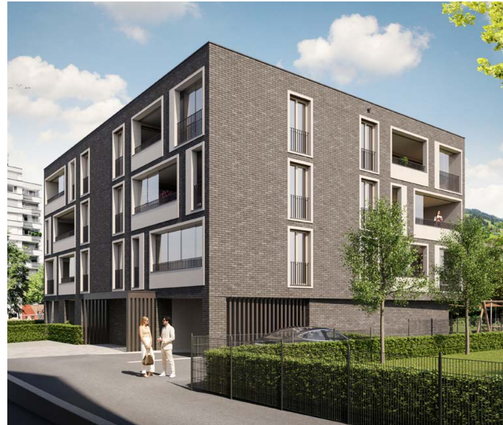
Wohnen im Zentrum In der Wohnanlage Kaspar-Hagen-Straße entstehen 14 Eigentumswohnungen mit Wohlfühlmosphäre.

Aicher ZT GmbH Hintere Achmühlstraße 1A A-6850 Dornbirn