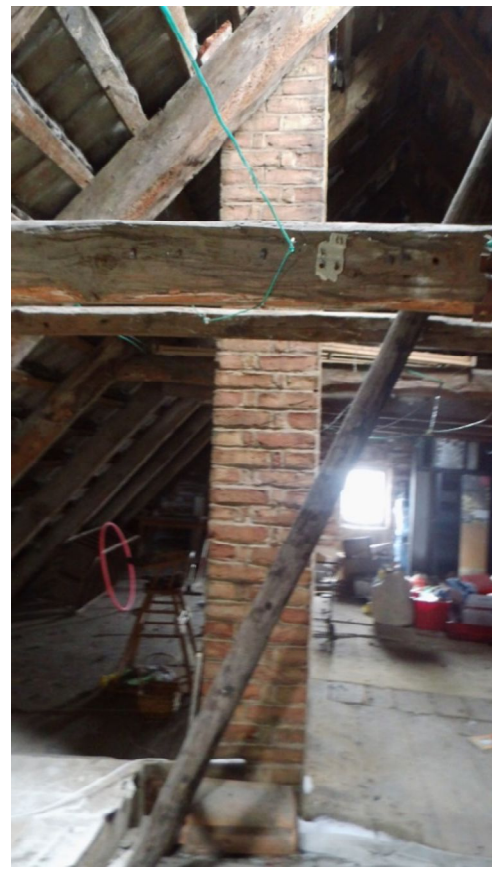
Treppe ins Dachgeschoss