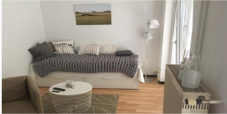
Bungalows Innenansichten: verschiedene Wohnräume - Bad - Küche