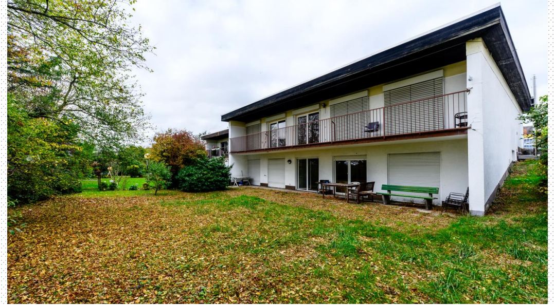
Bungalow 2 Rückseite mit Garten