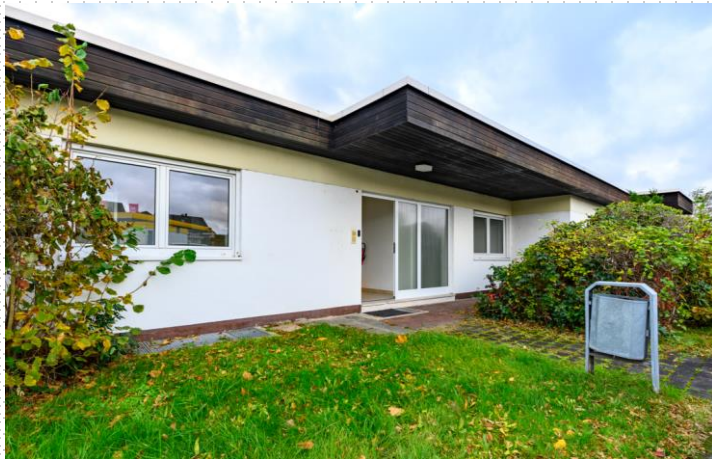
Bungalow 2 Eingang