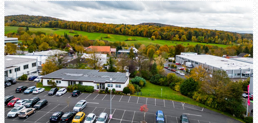
Luftaufnahme gesamtes Grundstück und Umgebung