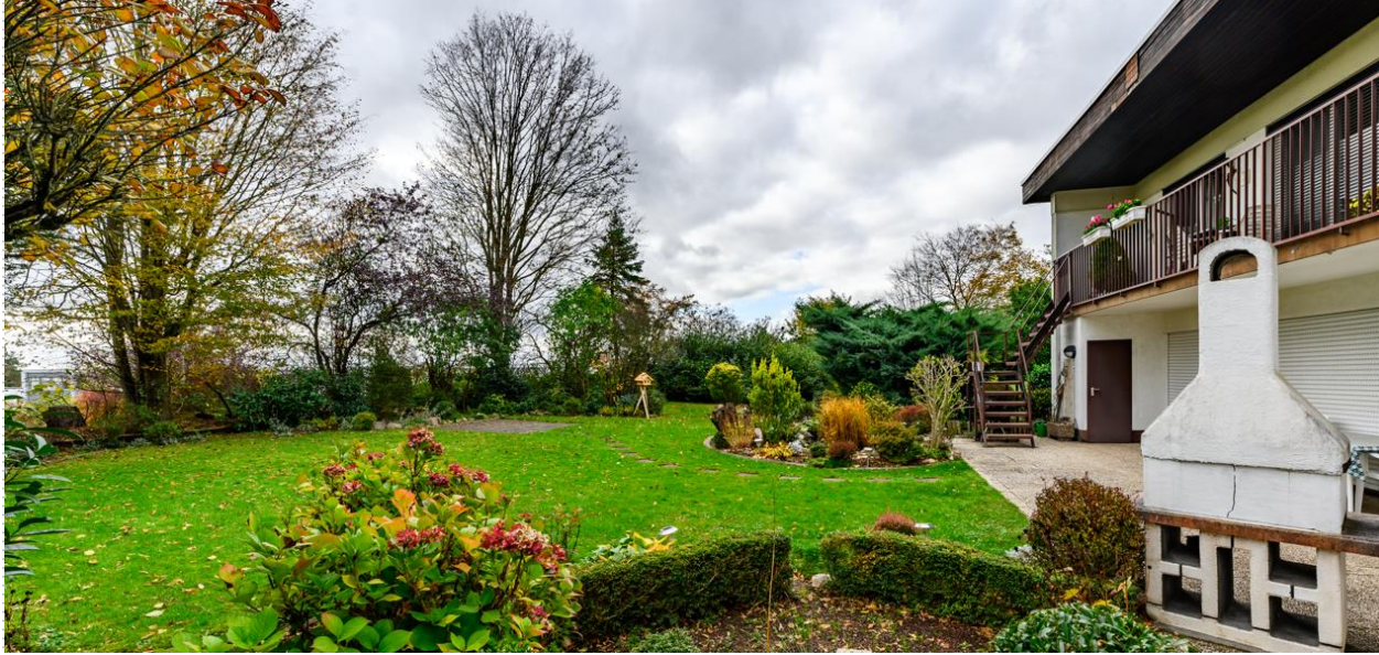
Bungalow 1 Rückseite mit Garten