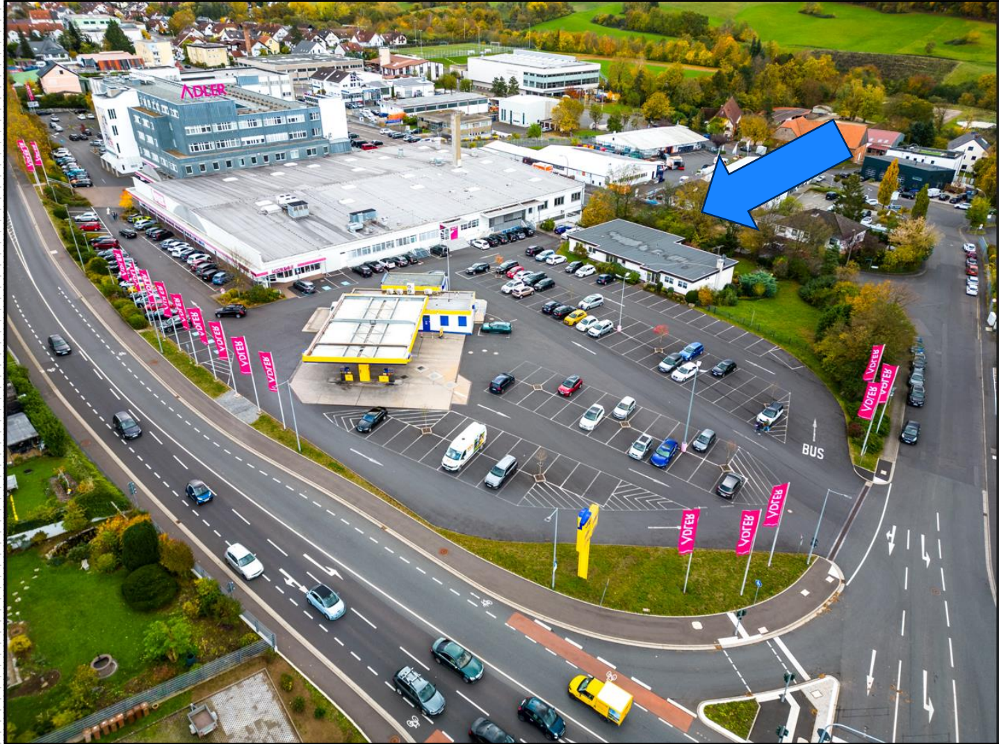
Luftbildaufnahme mit Umgebung