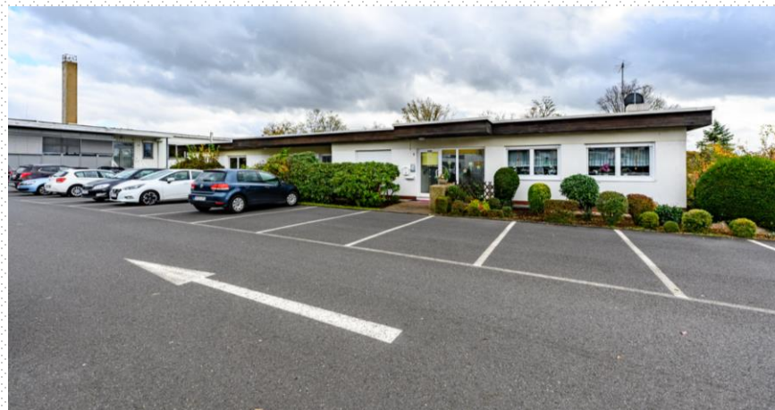
Bungalows Vorderansicht Stellplätze