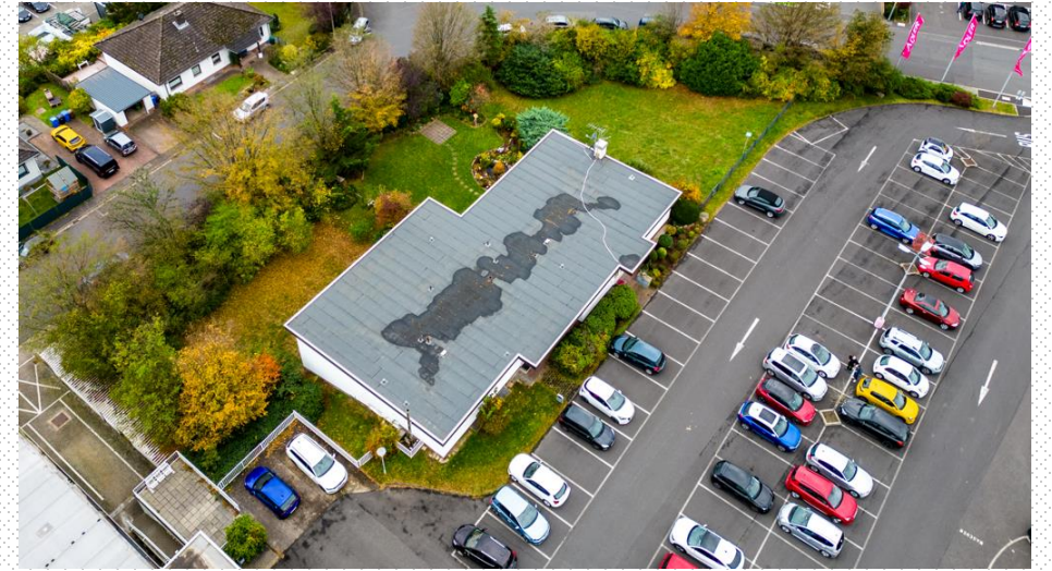
Luftaufnahme gesamtes Grundstück