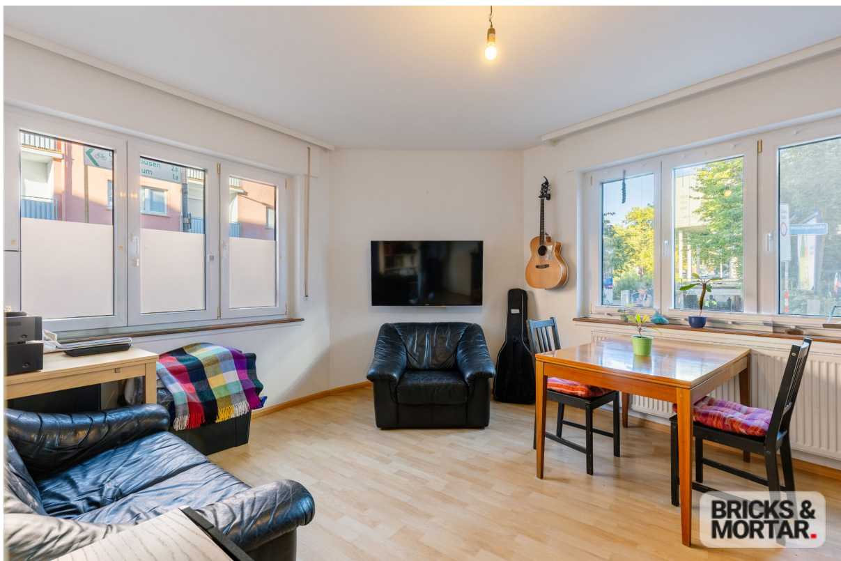
whg- Zimmer 2