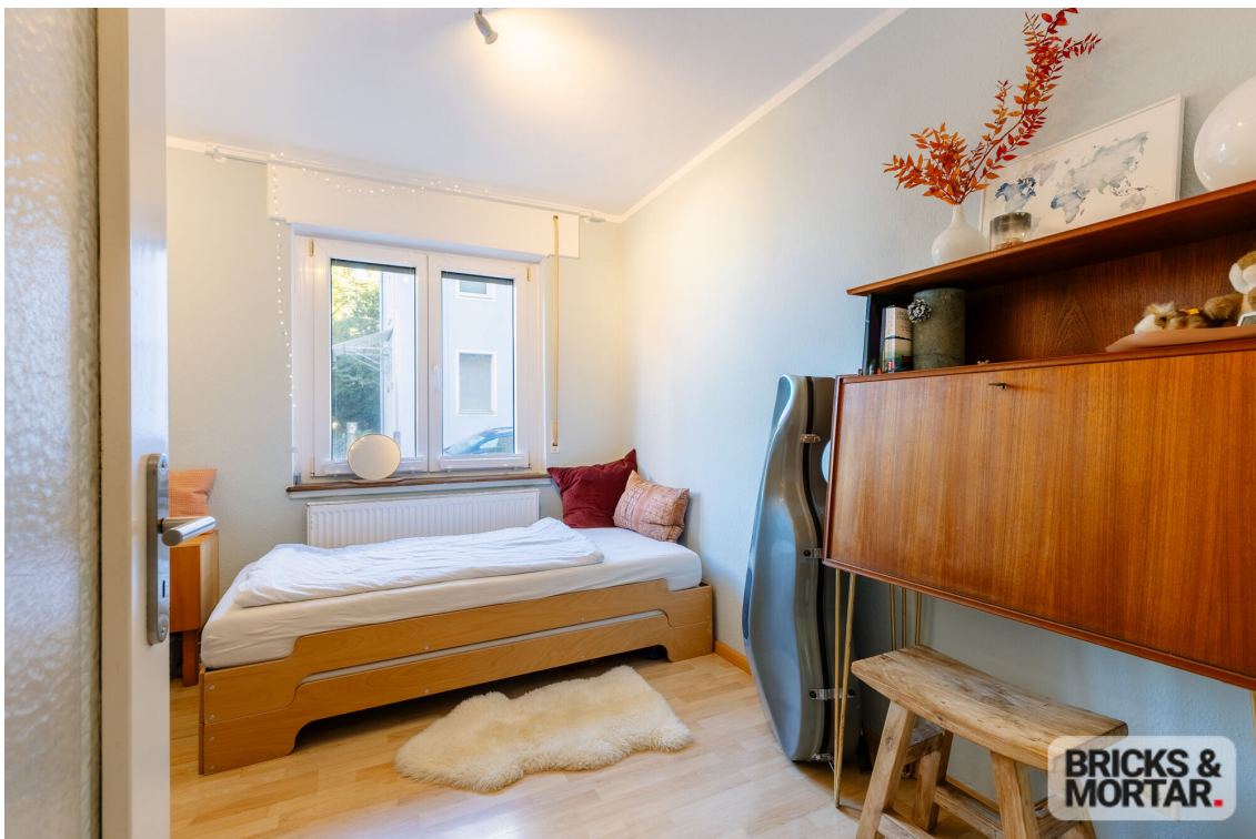
whg- Zimmer 1