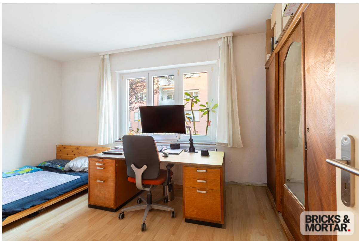
whg- Zimmer 3