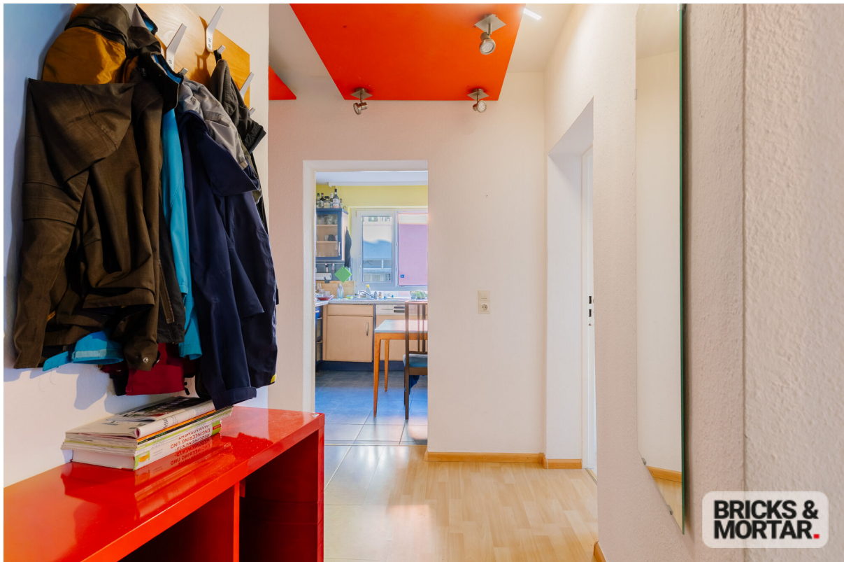
whg- Flur Eingang