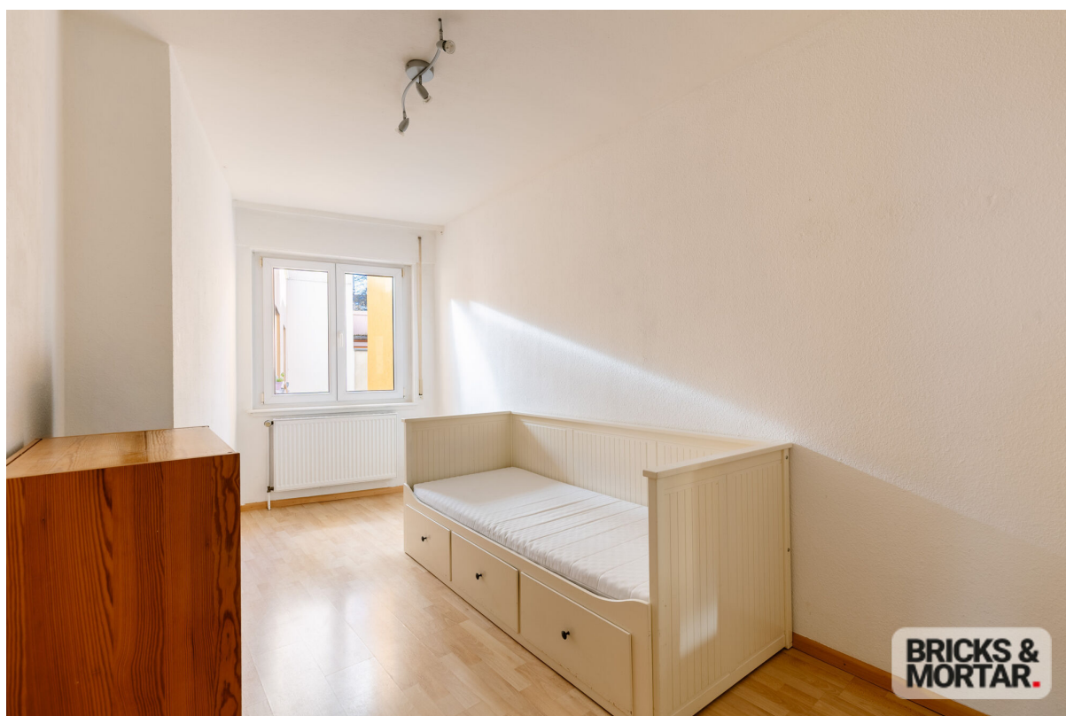
whg- Zimmer 3