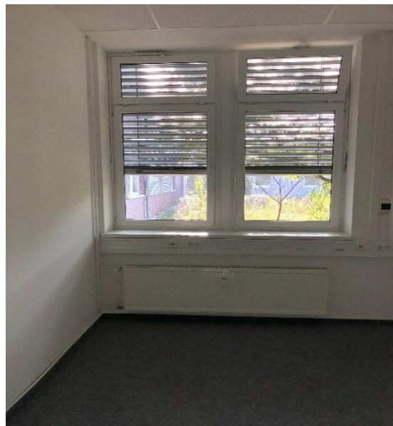
Büroraum (teilweise mit Außenjalousien)