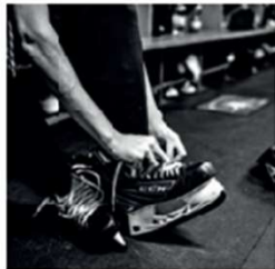
CURT-FRENZEL-STADION Die Eishockey-Arena wird bei Heimspielen zum Hexenkessel