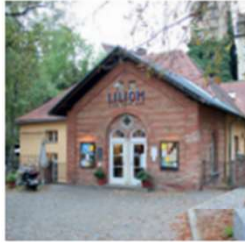
ANSPRUCHSVOLLES KINO IM LILIO Hier gibt's Filme jenseits vom Blockbuster-Sequel-Mainstream