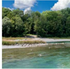
SONNENBADEN AM LECH Hier ist man bei gutem Wetter voll im Flow der Fuggertadt!