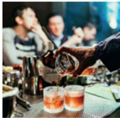
IHRE NEUE LIEBLINGSBAR Vom Leonsheart garantiert nur einen Katzensprung entfernt