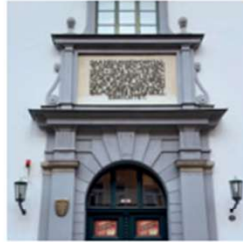
AUGSBURGER PUPPENKISTE Der Geburtsort von Jim Knopf und Lukas, dem Lokomotivführer