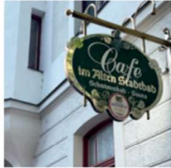
WELLNESS IM ALTEN STADTBAD Schwimmen und Saunieren im historischen Jugendstil-Ambiente

Einkaufsmöglichkeiten gehören im Leonsheart also genauso zur Nachbarschaft wie der Hofgarten, die Fuggerei und der Grüngürtel des Stadtgrabens.