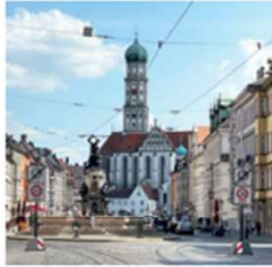
MAXIMILIANSTRASSE Augsburgs „Fifth Avenue“ zum Shoppen und Schlemmen