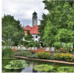
ENTSCHLEUNIGEN IM HOFGARTEN Die barocke Parkanlage mit Feel-good-Faktor.