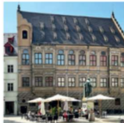
CHARMANTE CAFÉS ... reihen sich in der Altstadt wie Perlen an einer Kette