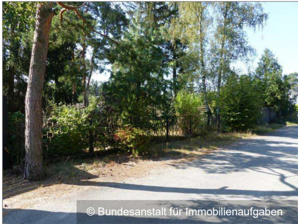
Straße „Am Sportplatz“