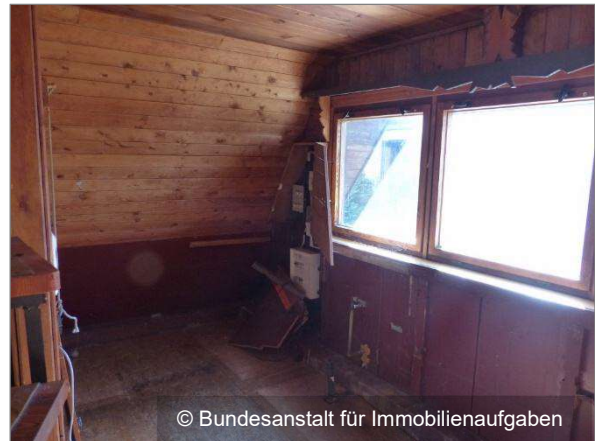
Innenansicht hinterer Bereich