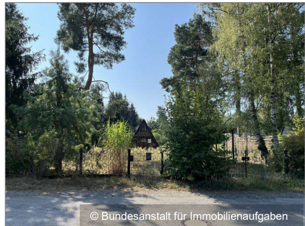
Blick auf das Grundstück