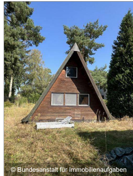
Rückansicht der Erholungsfinnhütte