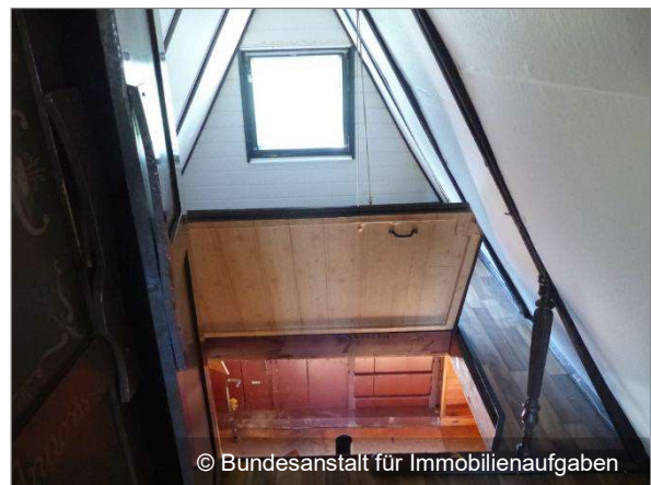
Dachluke im Spitzboden