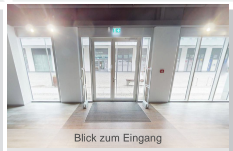
Blick zum Eingang