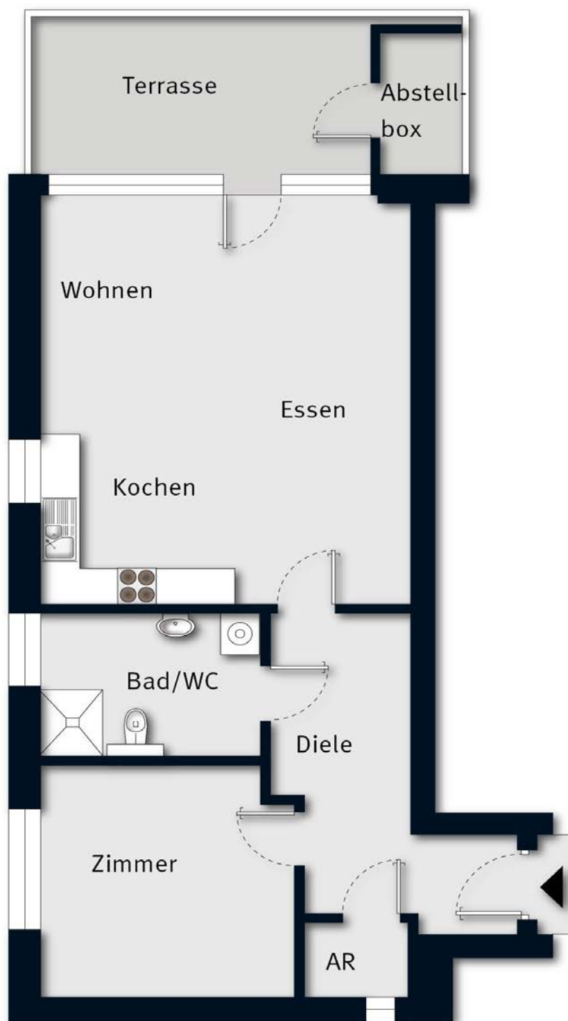
Grundriss ohne Maßstab