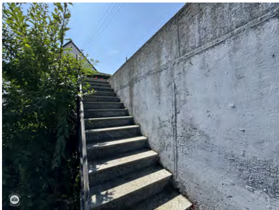
Zugang zum Haus