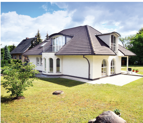
Spremberg OT Sellessen

Erik Weber Immobilien - Marketing e.K. Dresdener Straße 1 b 03130 Spremberg Telefon: 03563 92500 Mobil: 0172 7922760 www.erikweber-immobilien.de