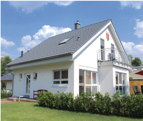
Spremberg, Erlengrund 20