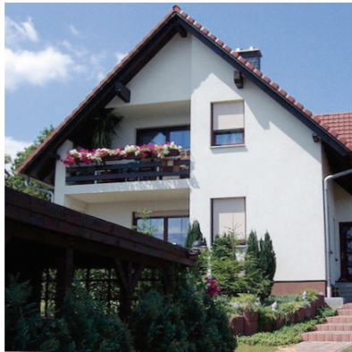
Spremberg, Morgenröte 2