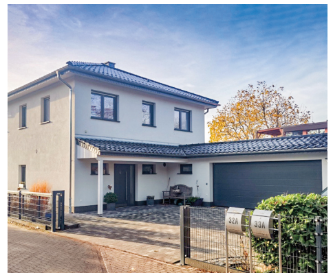
Cottbus - Ströbitz

Erik Weber Immobilien - Marketing e.K. Dresdener Straße 1 b 03130 Spremberg Telefon: 03563 92500 Mobil: 0172 7922760 www.erikweber-immobilien.de