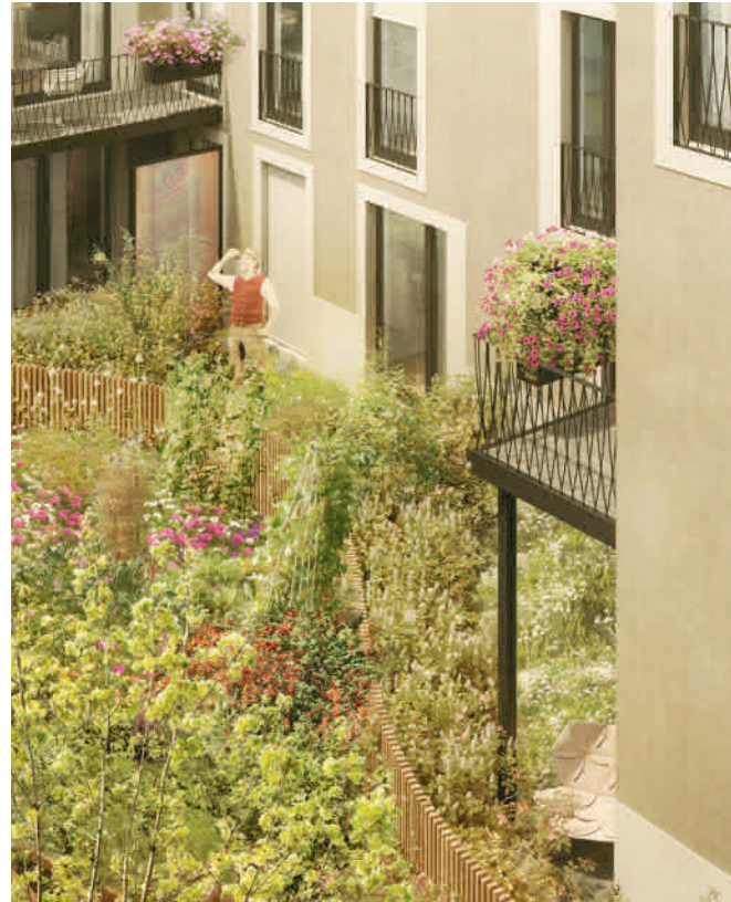
Visualisierung aus Sicht des Illustrators / Beispielbild