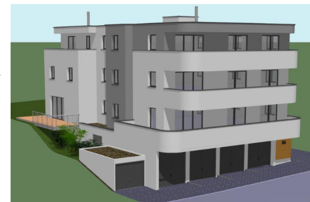
unverbindliche Illustration Mühlweg 55, 08107 Kirchberg