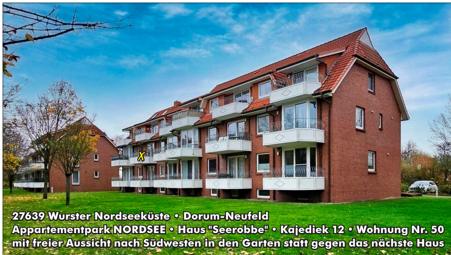
27639 Wurster Nordseeküste • Dorum-Neufeld Appartementpark NORDSEE • Haus "Seerobbe" • Kajediek 12 • Wohnung Nr. 50 mit freier Aussicht nach Südwesten in den Garten statt gegen das nächste Haus

Dorum-Neufeld • nah zum Nordseedeich und Grünstrand, zum Wellenbad, zum Kutter- und Sportboothafen • 2-Zi.-App. • 1. Etage • Südwest-Lage