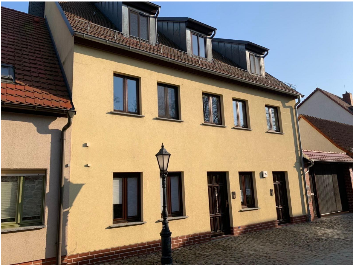
Straßenansicht beider Gebäudeteile und der überdachten Einfahrt in den Innenhof

365 m 2 Wohnfläche sowie 70 m 2 weitere Nutzfläche