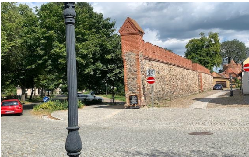
Blick in die Umgebung und in die verkehrsberuhigte Zone

Selbstnutzer werden ein schöneres Wohnen im Herzen des historischen Altstadt-kerns von Beeskow kaum finden: Haus in verkehrsberuhigter Zone, viel Grün mit ruhigem Innenhof, Parkplatz am Haus, das Fahrrad im abschließbaren Schuppen, Erholung im Garten oder auf dem Balkon und alles, was man zum Leben braucht (Einkaufsmöglichkeiten, Schulen, Gymnasium, Musikschule, Kitas, Kulturangebote, Cafés oder Restaurants, Arztpraxen, Apotheken und Krankenhaus, ...) immer zu Fuß zu erreichen.