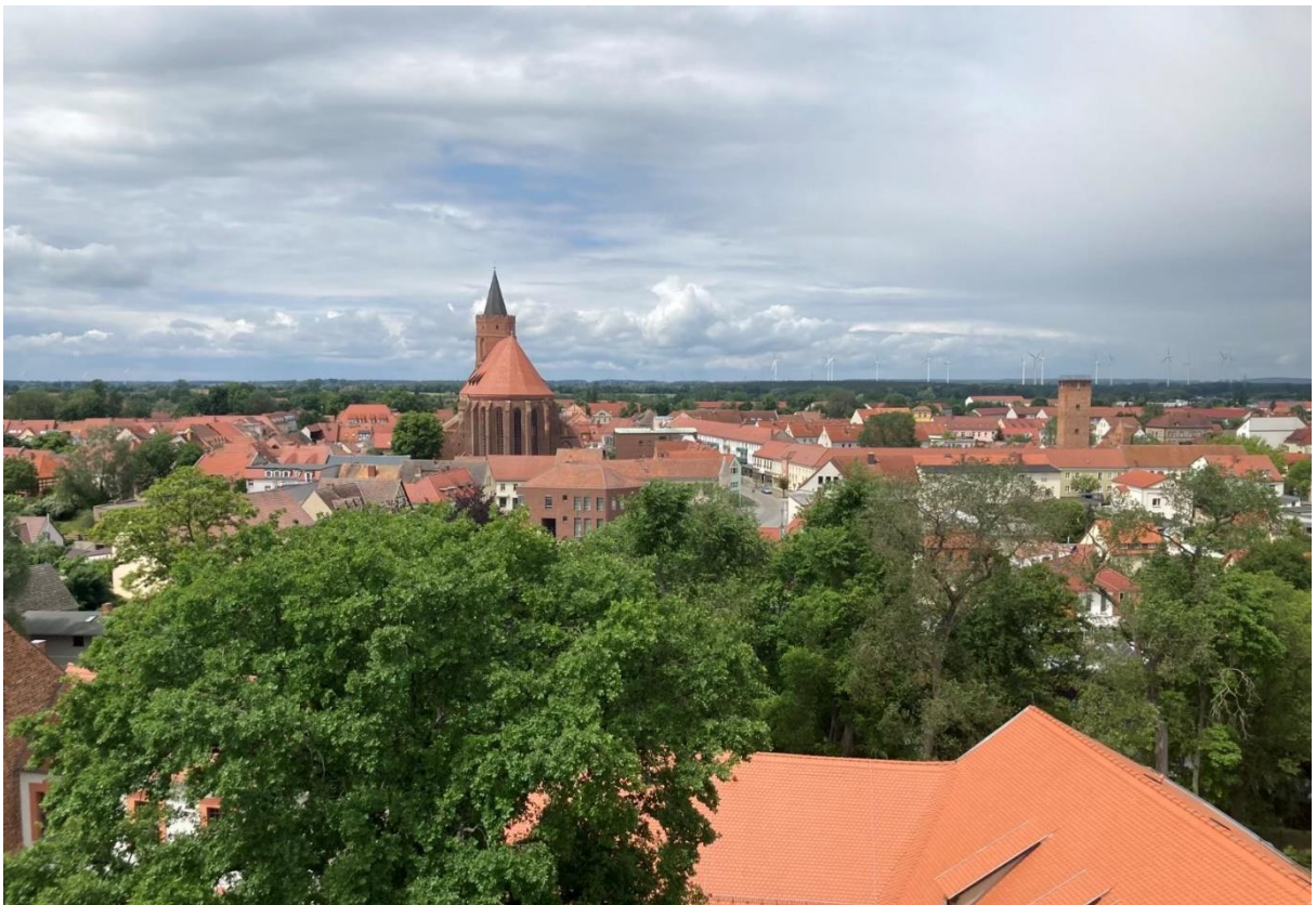
Beeskow Luftbild mit Blick auf die Marienkirche