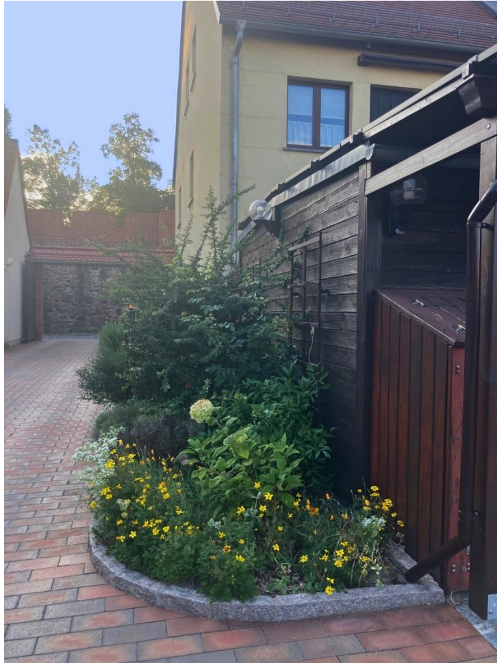
Blick vom Innenhof zur Toreinfahrt mit Grünstreifen