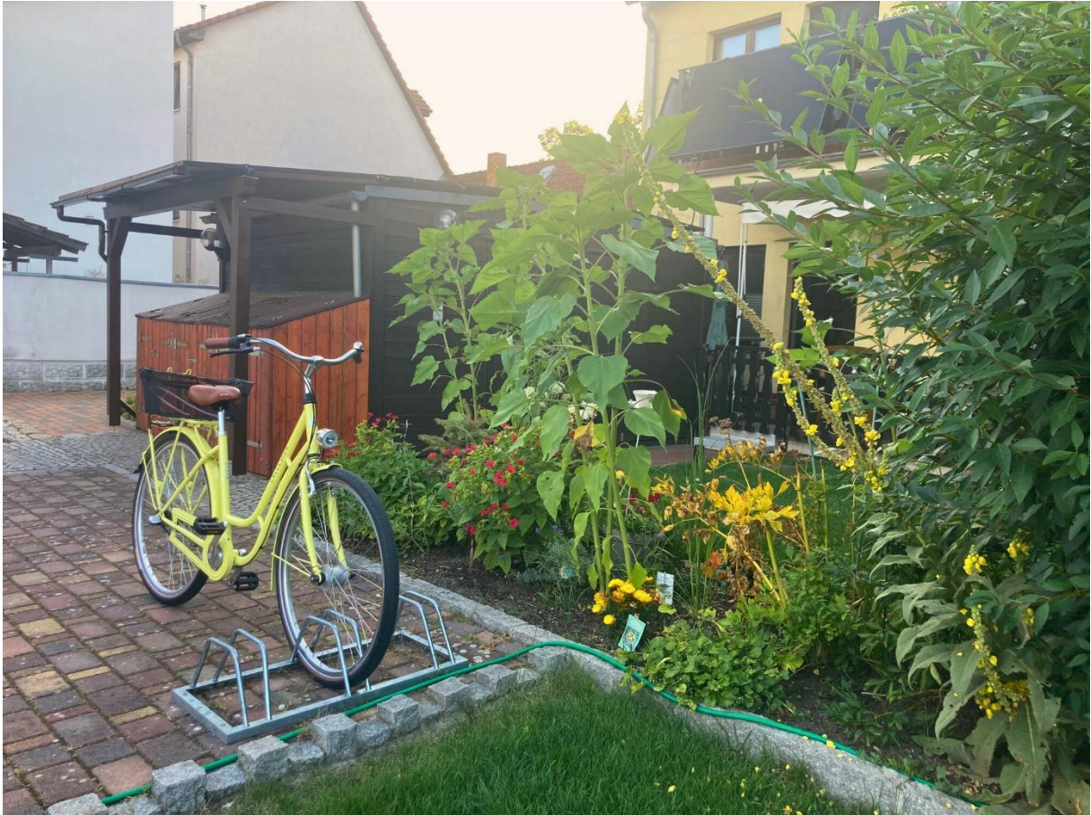
Blick vom Innenhof auf den Garten der Wohnung 1, den Geräteschuppen und den eingefassten Müllsammelplatz sowie den ersten PKW-Stellplatz