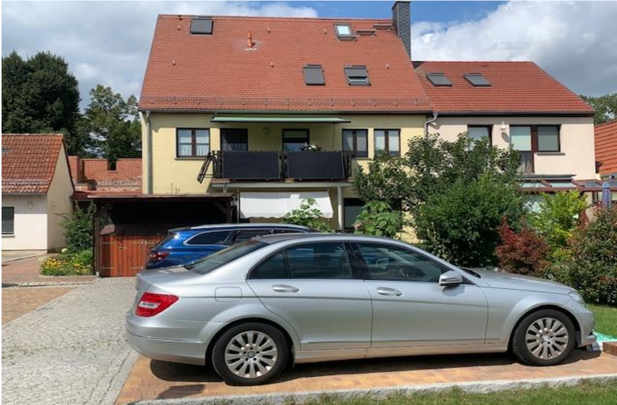
Blick über die PKW-Stellplätze zu den beiden Gebäudeteilen mit Garten, Fahrradschuppen überdachter und eingefasster Stellfläche für die Mülltonnen sowie der Überfahrt