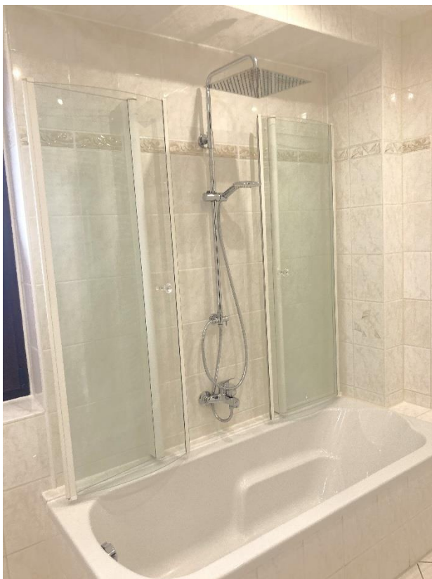
Wohnung 1 - Wannenbad