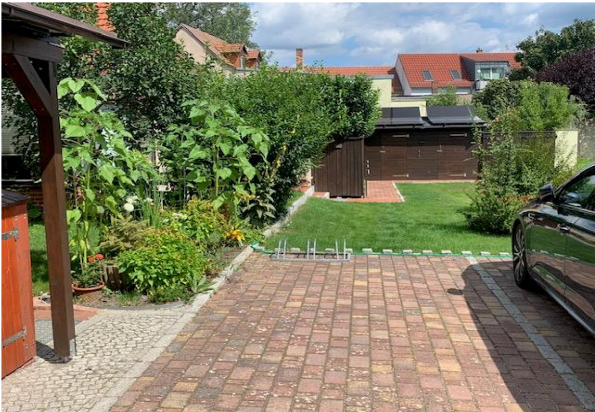
Blick auf einen PKW-Stellplatz der WEG und den zweiten Fahrrad-/Geräteschuppen mit Solaranlage