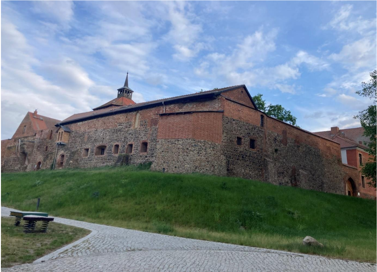
Umgebung der Wohnung: die Burg Beeskow ist zu Fuß in ca. 10-15 min erreichbar