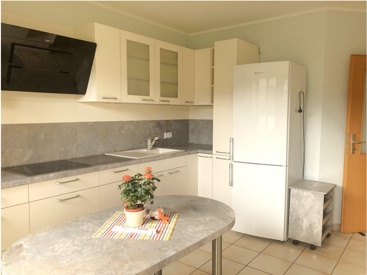
Wohnung 1 - Blick in die Küche von der Terrassentür aus