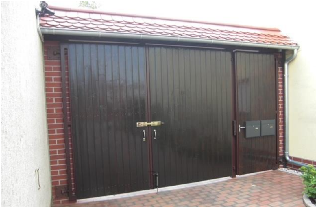
Hofter (Blick vom Innenhof): Über die gemeinsam genutzte Überfahrt gelangt man in den Innenhof