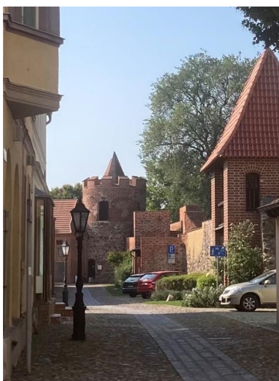
Blick in die Mauerstraße