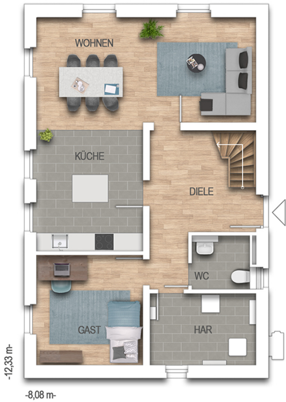
Das Unverbesserierte C340 Grundriss EG