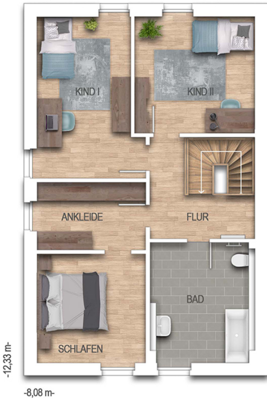
Das Unverbesserierte C340 Grundriss 1.OG