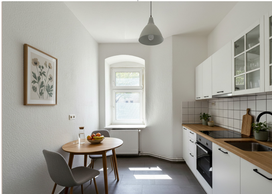
Digitale Möblierung | digital staging