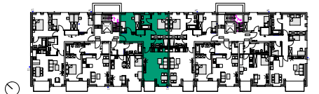
Haus B: Grundriss 2. Obergeschoss