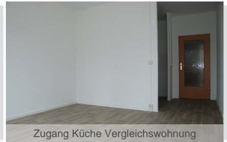
Zugang Küche Vergleichswohnung