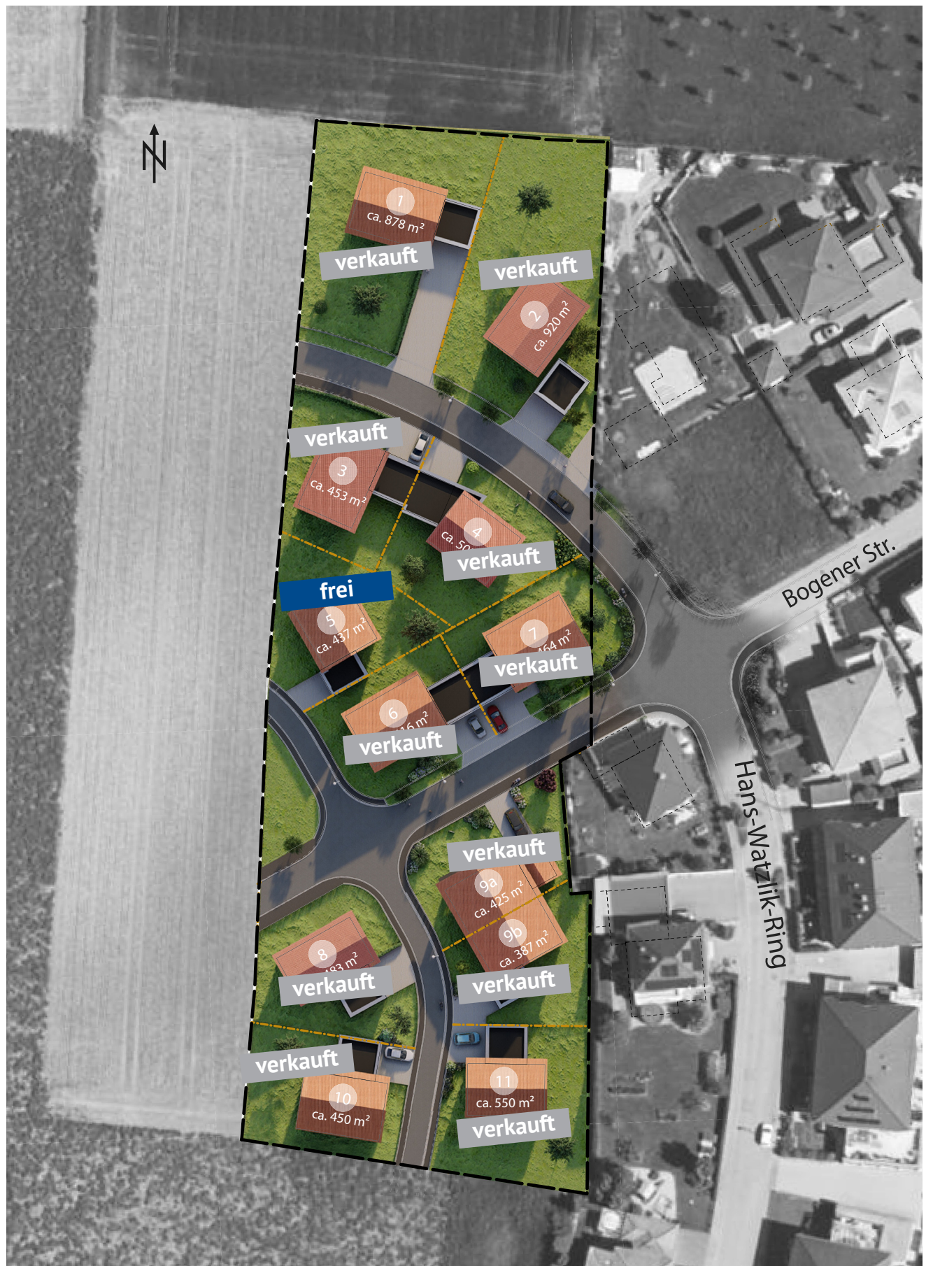
Abb. Visualisierung Bebauungsbeispiele