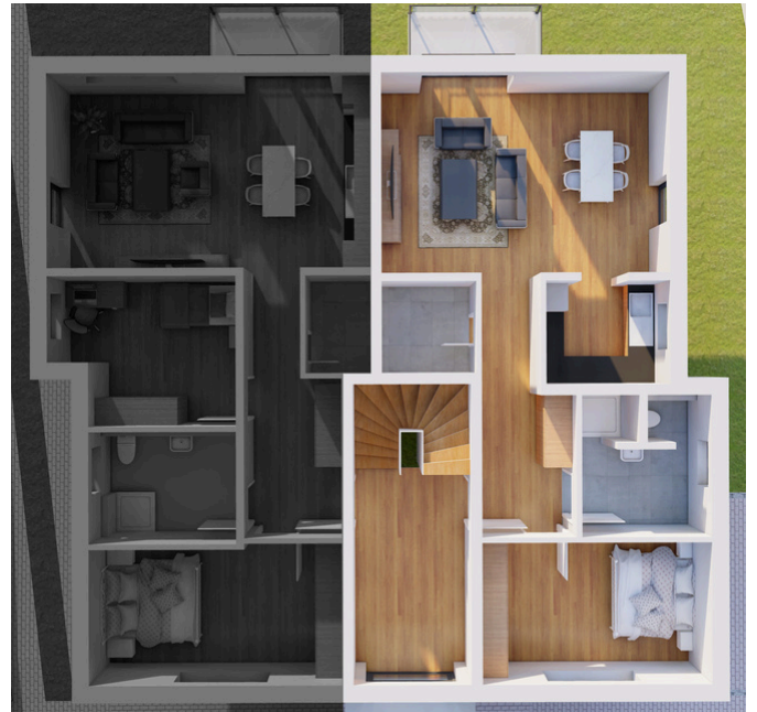
Dachgeschoss Wohnung Nummer 5