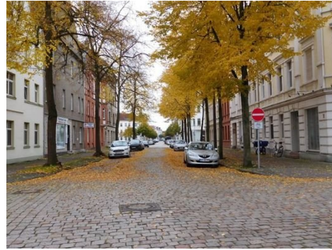
Johannes-Runge-Straße nach Süden