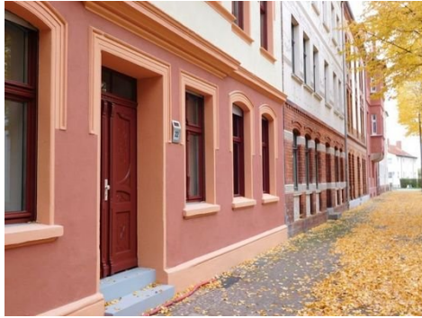
Johannes-Runge-Straße nach Norden