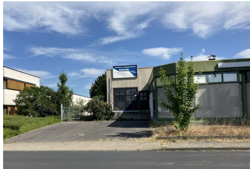
Frontansicht auf Werkstatt/Lager