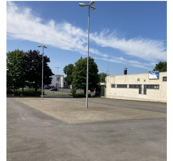
Sicht auf Parkplatz & Seitenansicht Werkstatt/Lager