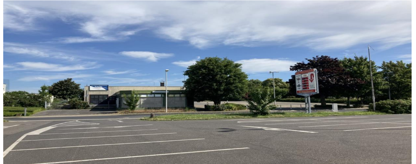
Blick vom gegenüberliegenden Parkplatz auf das Grundstück