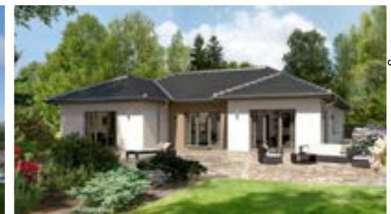
Abbildungen mit Sonderwünschen.