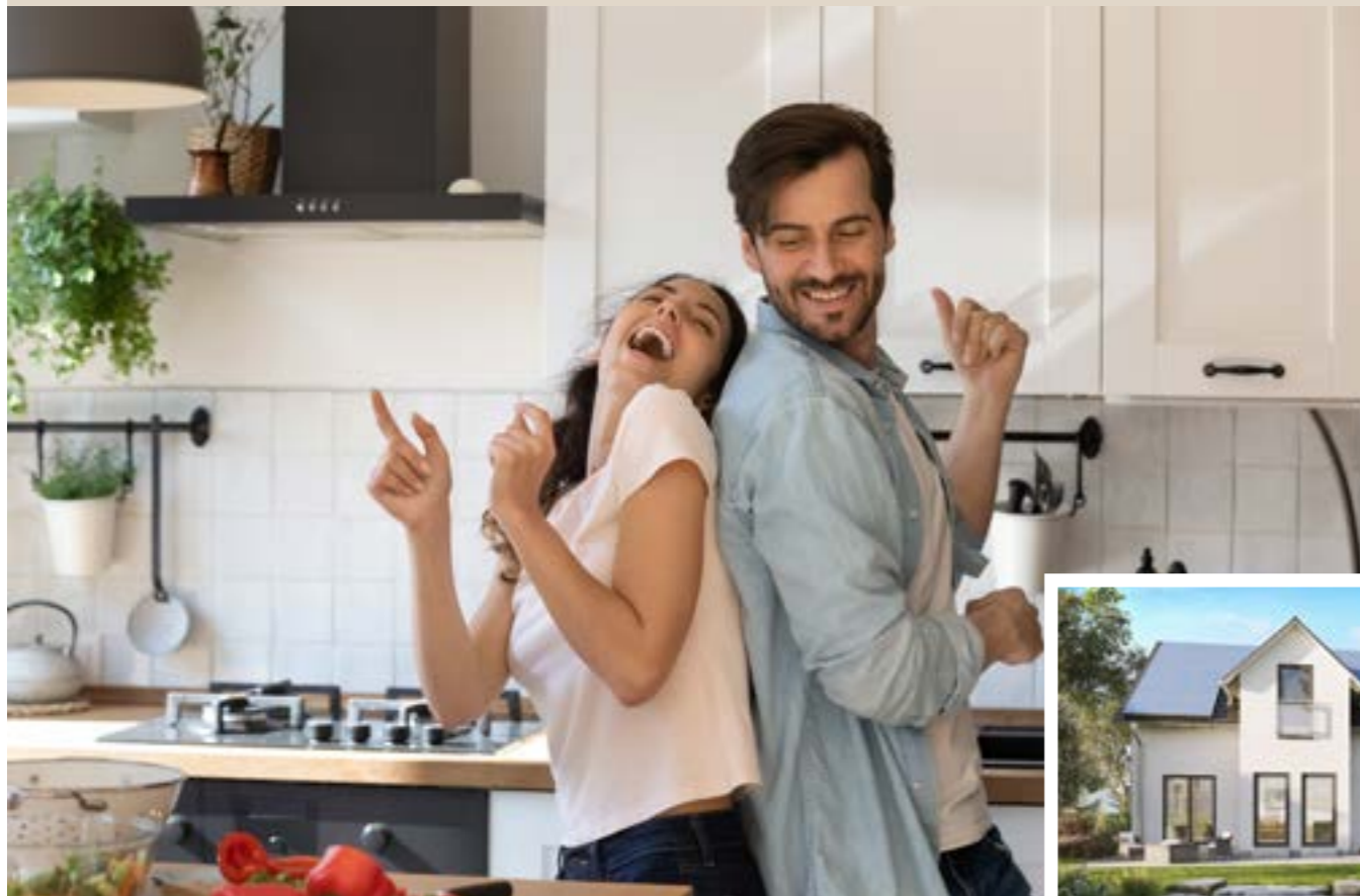
Abbildungen mit Sonderwünschen.