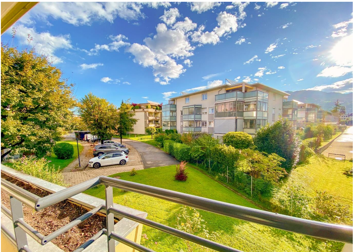
Ausblick nach Osten