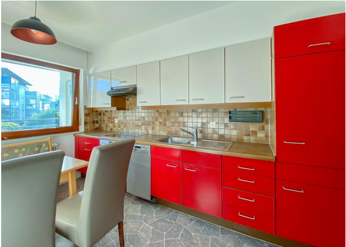
Küche mit Essplatz