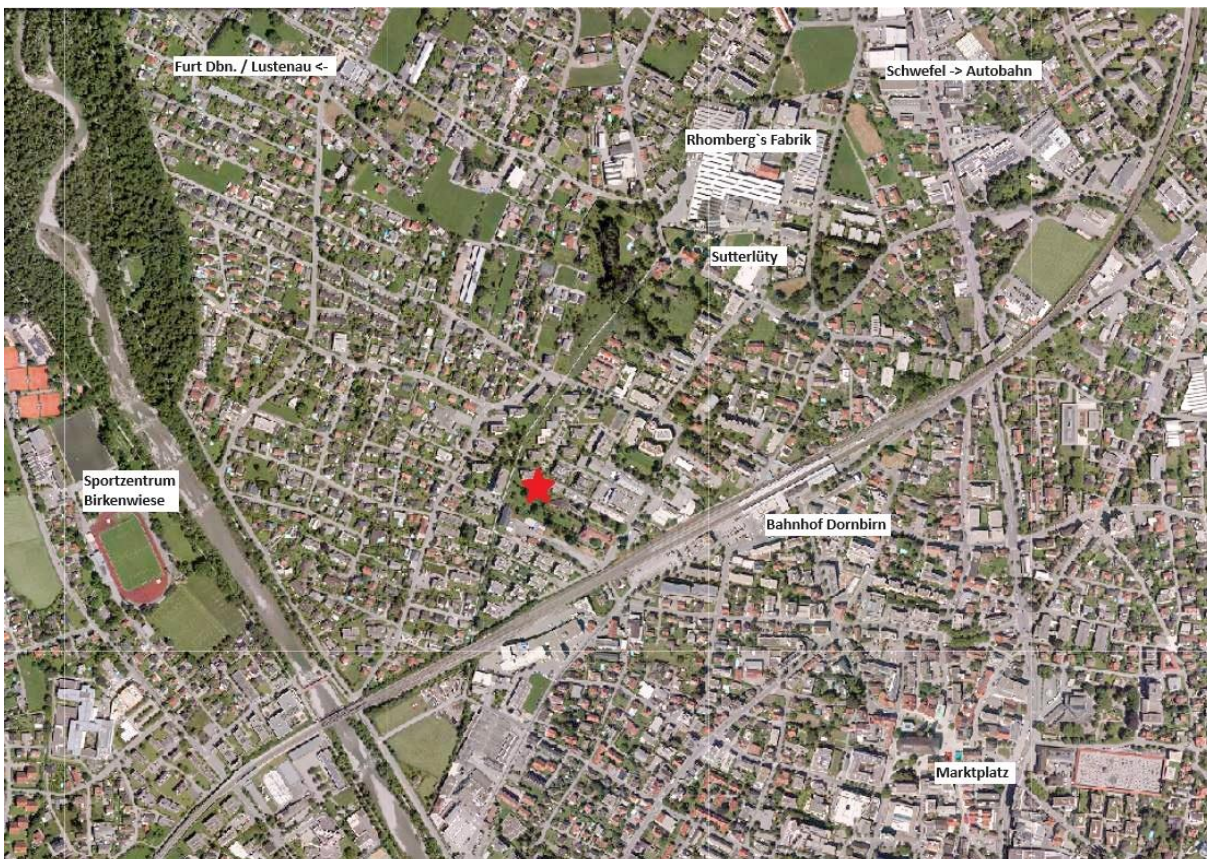
Lageplan / Anfahrtsplan