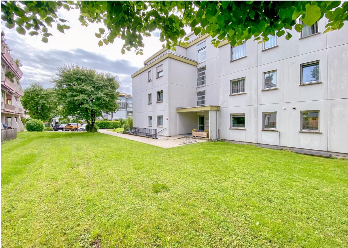
Ansicht Nord – viel Grünfläche