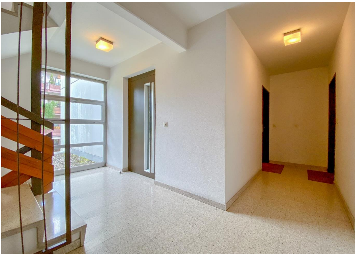
Zugang zur Wohnung