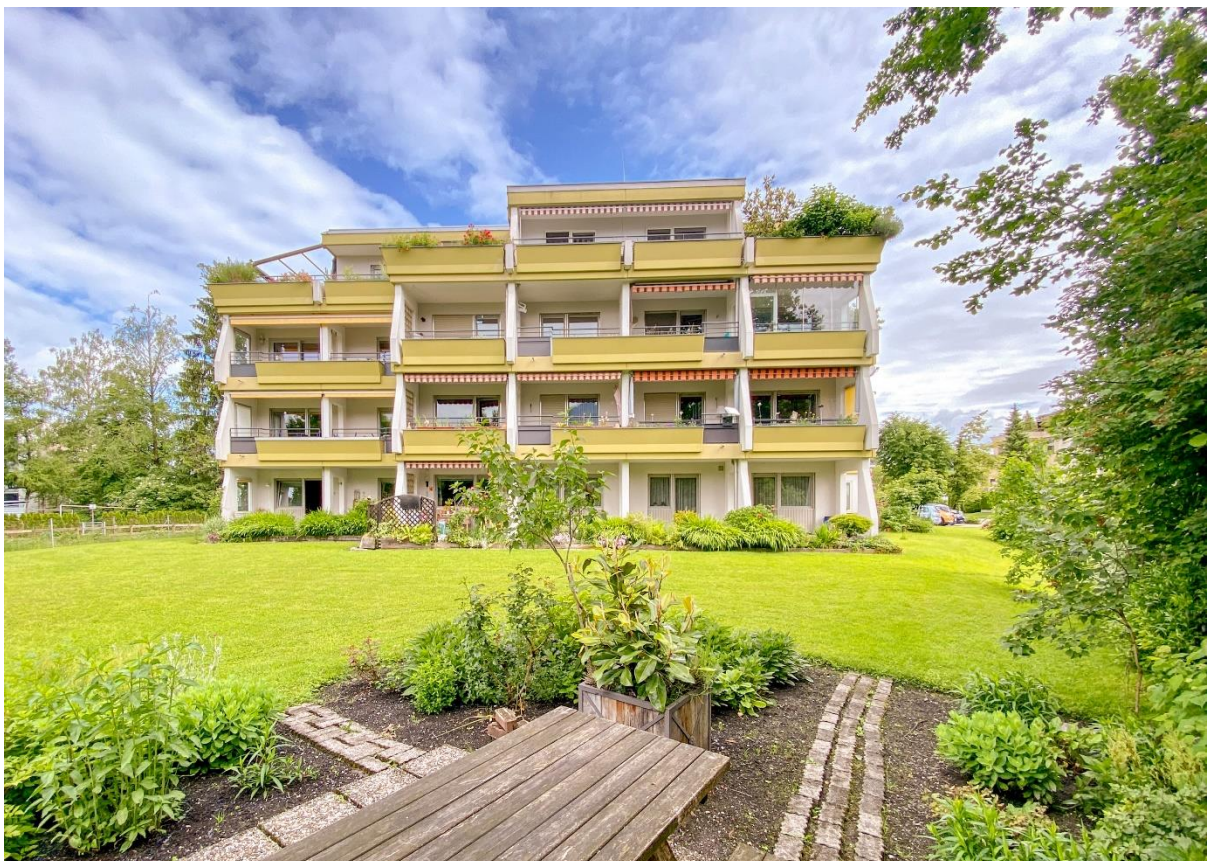
Ansicht Süd mit Grillplatz im Vordergrund