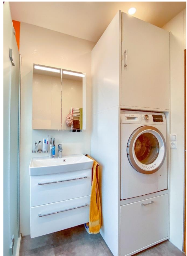
Waschbecken / WM