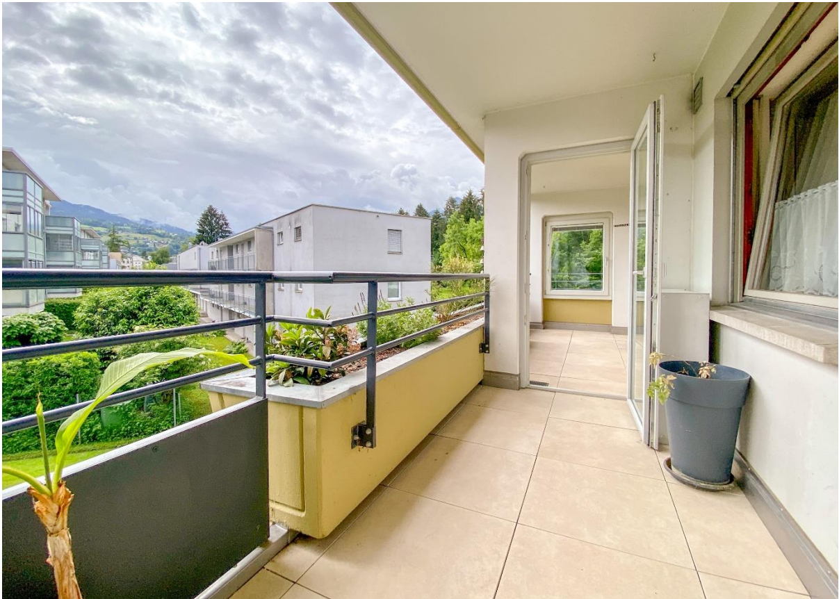
Terrasse mit Morgensonne