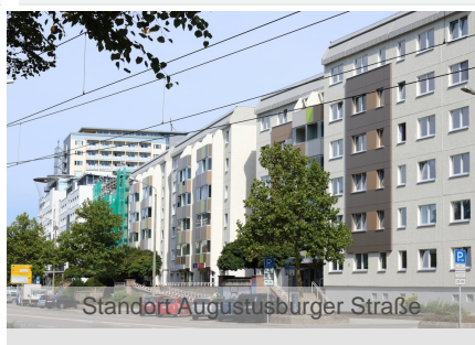
Standort Augustusburger Straße