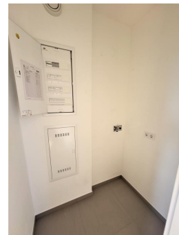
Abstellkammer mit Waschmaschinenanschluss