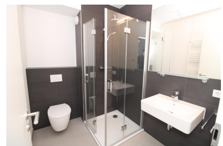
Bad mit Regendusche