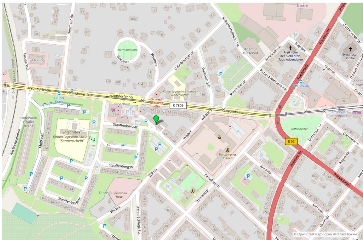
Umgebungskarte für „Pestalozzistraße 70-72 in 08523 Plauen“