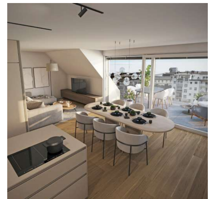
Rendering Top 10