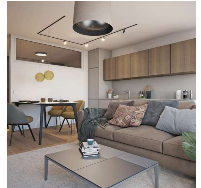
Rendering Top 4