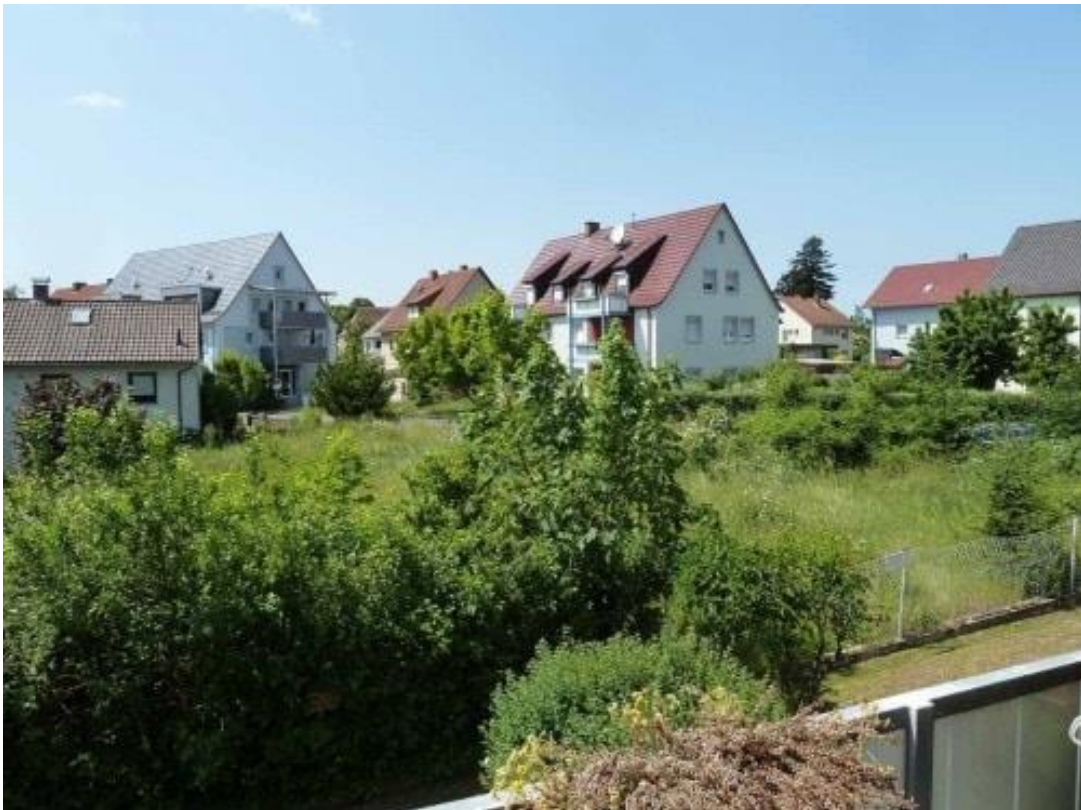
Blick auf das Baugrundstück... Wohnen in ruhiger, grüner Lage