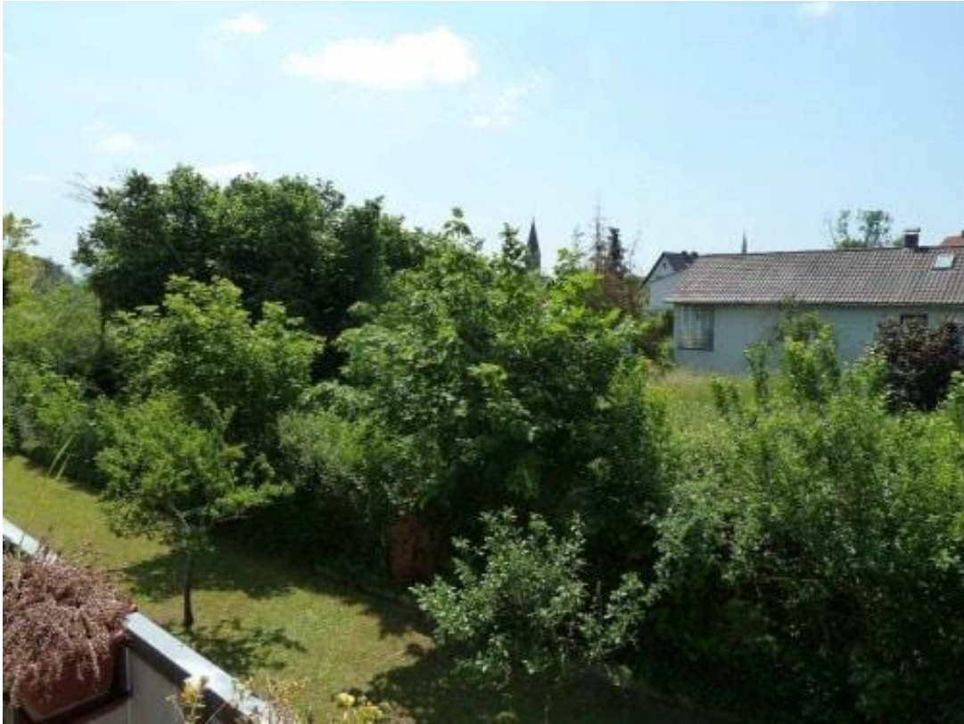
Blick auf das Baugrundstück... Wohnen in begehrter Lage