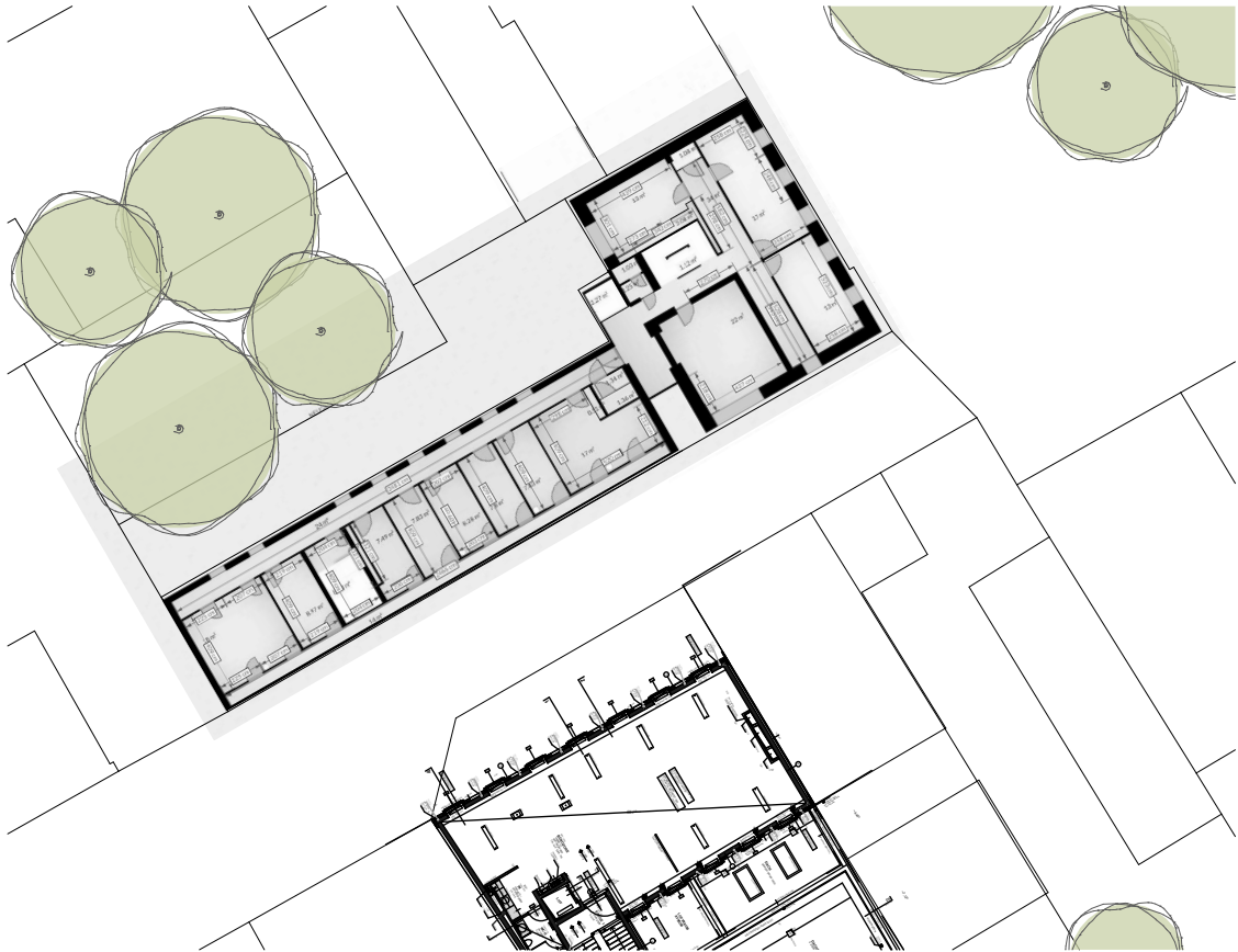
2. Obergeschoß 1:500