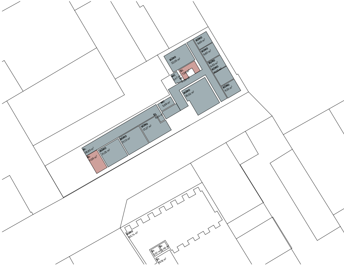
3. Obergeschoß 1:500