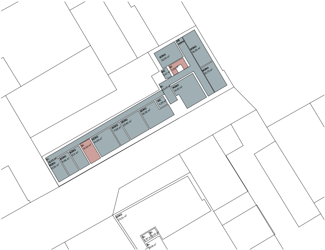
2. Obergeschoß 1:500