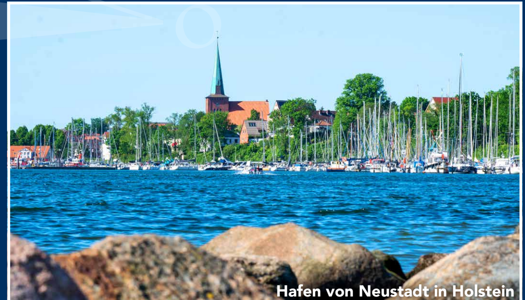
Hafen von Neustadt in Holstein