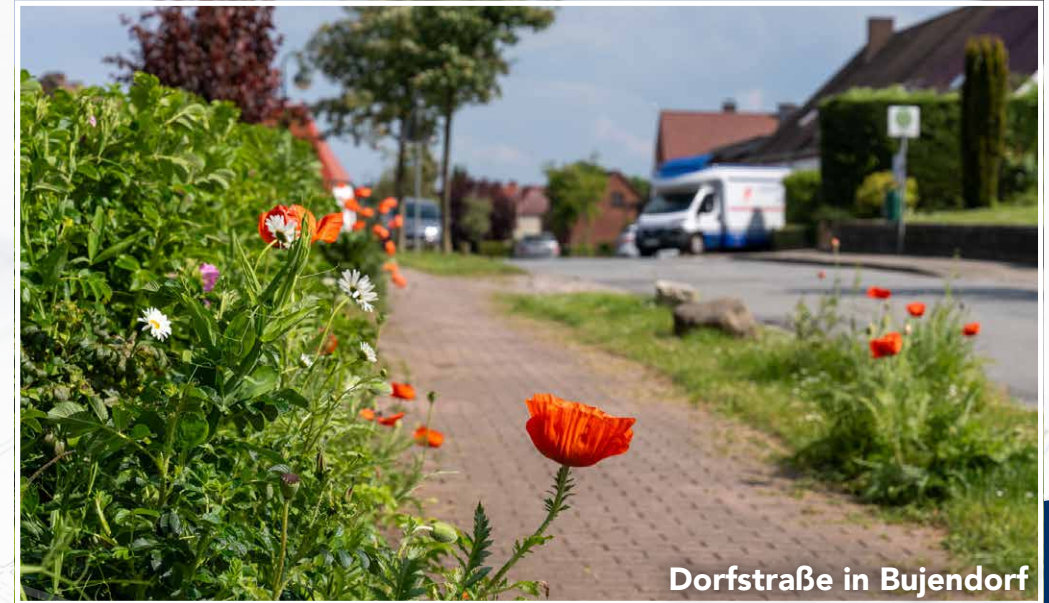
Dorfstraße in Bujendorf

Die Ortschaft gehört zur Ostholsteiner Gemeinde Süsel und liegt unweit der Lübecker Bucht, wo die bekannten Ostseebäder Haffkrug, Scharbeutz und Timmendorfer Strand zur Naherholung einladen. Ebenfalls in der Nähe befindet sich Neustadt in Holstein, eine historische Hafenstadt, mit einzigartigem Flair und viel maritimen Charme.