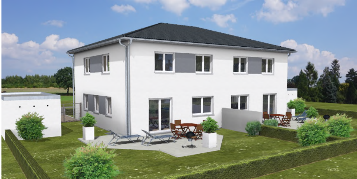
Das Bild enthält Sonderwünsche