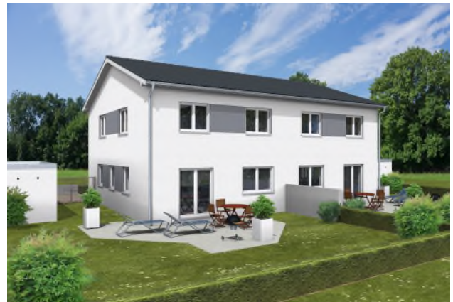
Variante mit Satteldach ist auch möglich