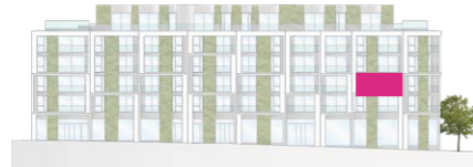
Haus A - Ansicht Süd