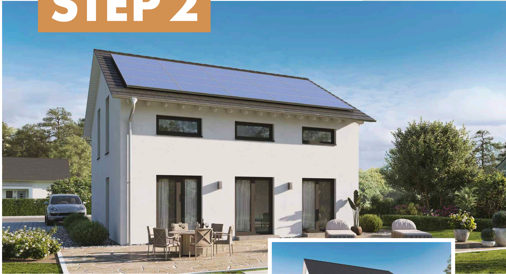
Abbildungen mit Sonderwünschen.