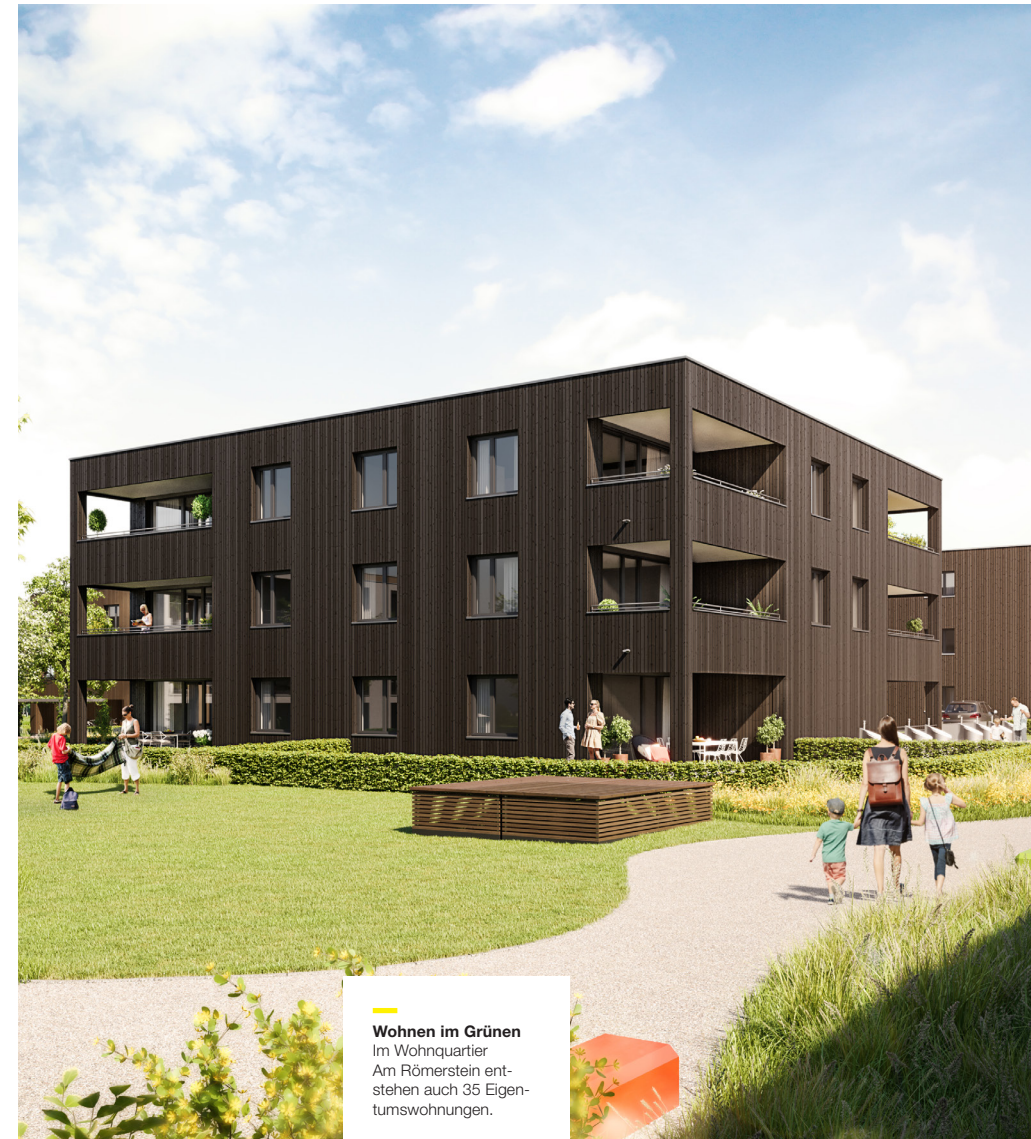
Wohnen im Grünen Im Wohnquartier Am Römerstein entstehen auch 35 Eigentumswohnungen.