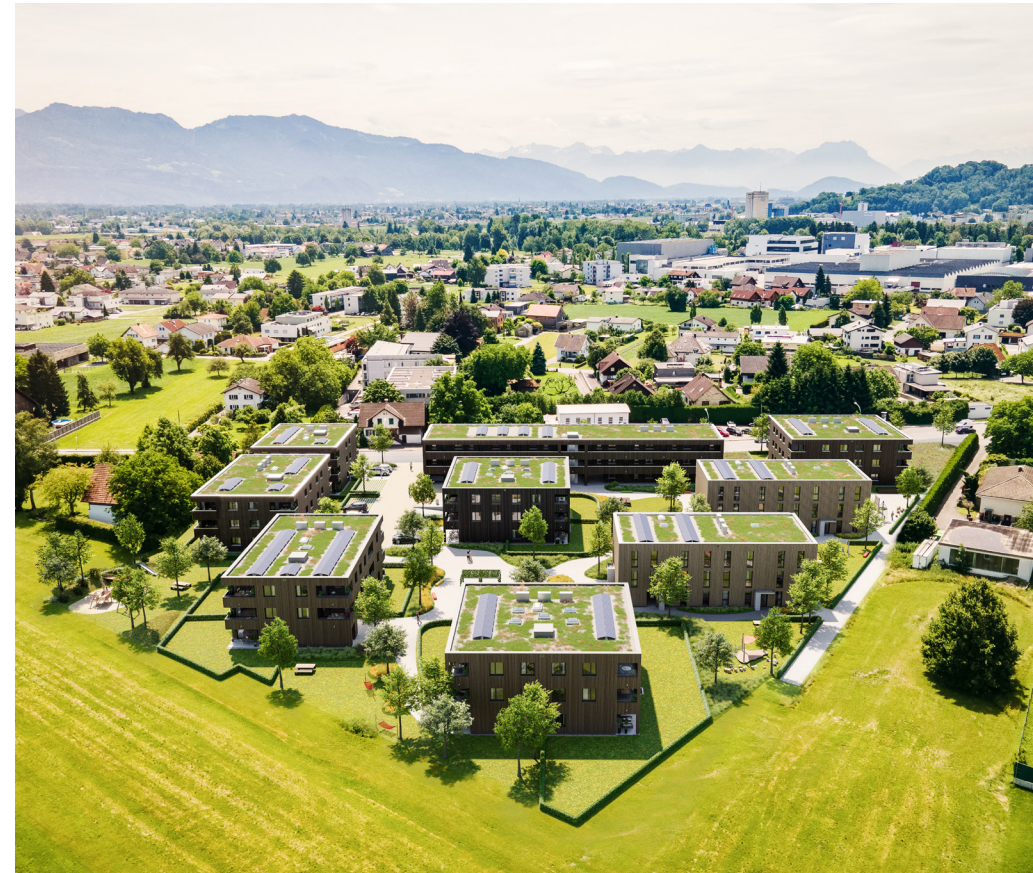
Natürlich eingefügt Die dreigeschossigen Mehrfamilienhäuser mit begrünten Dächern integrieren sich in die bestehende Siedlungsstruktur.

Baumschlager Hutter ZT GmbH Schlossstraße 211 CH-9435 Heerbrugg