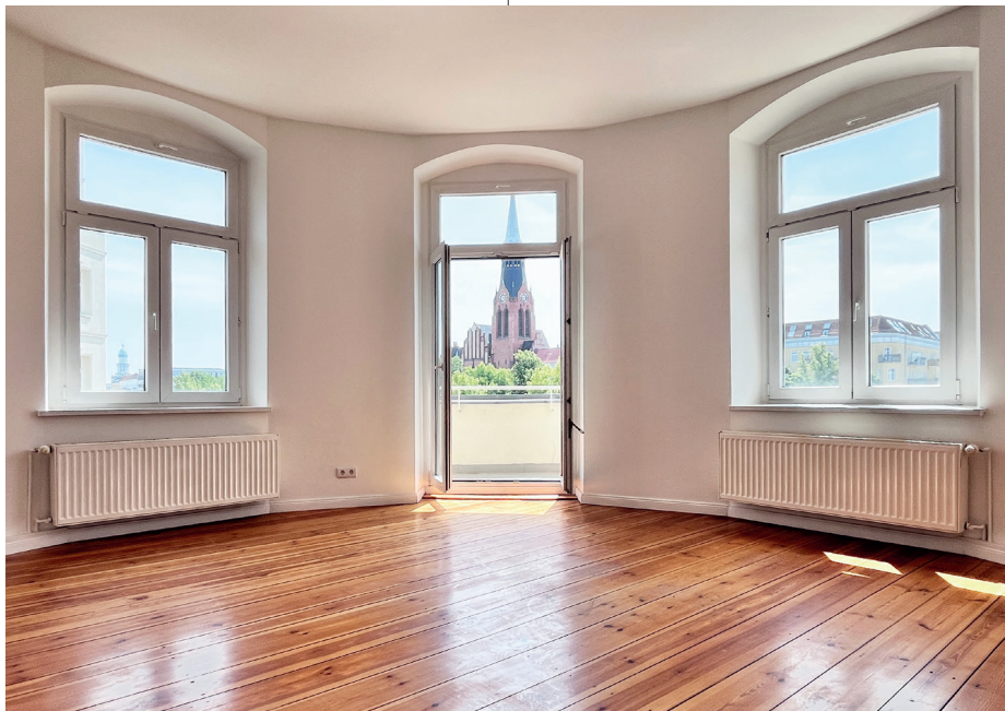
Wohnzimmer mit Blick auf Pfingstkirche | Living room with view on Pfingstkirche