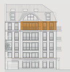
Stadthaus Vorderansicht Elvirastrasse