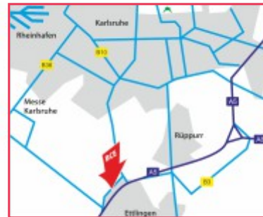
Am Hardtwald 7-11, 76275 Ettlingen