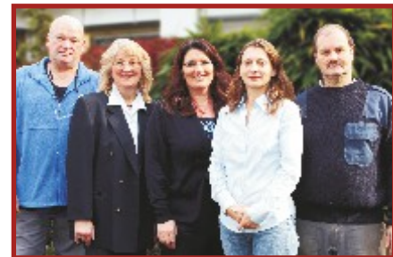
Wir schaffen Ihnen Freiräume

Gerne präsentieren wir Ihnen Ihr neues Büro bei einer unverbindlichen Besichtigung.