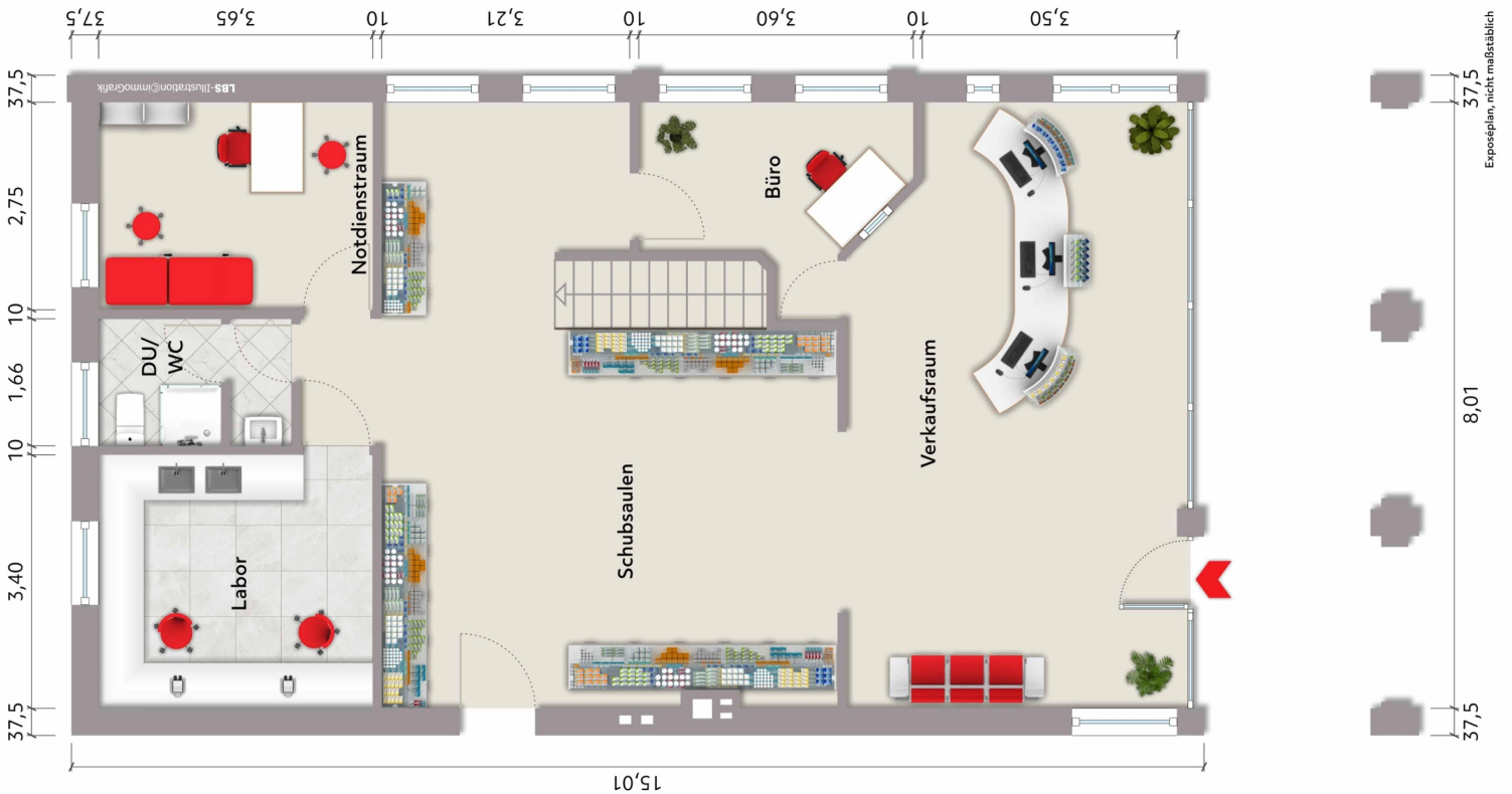
Grundriss EG (Einrichtungsbeispiel)