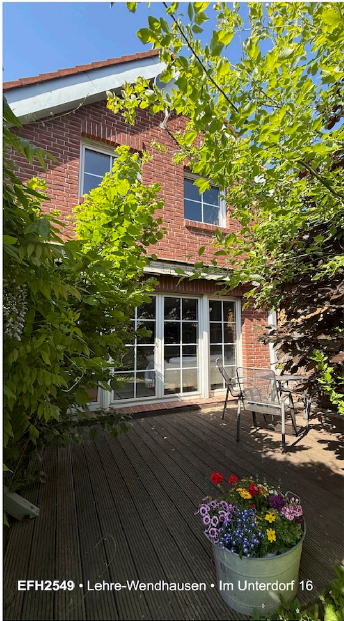
EFH2549 • Lehre-Wendhausen • Im Unterdorf 16