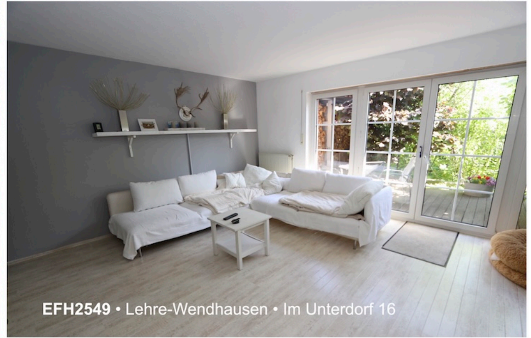
EFH2549 • Lehre-Wendhausen • Im Unterdorf 16