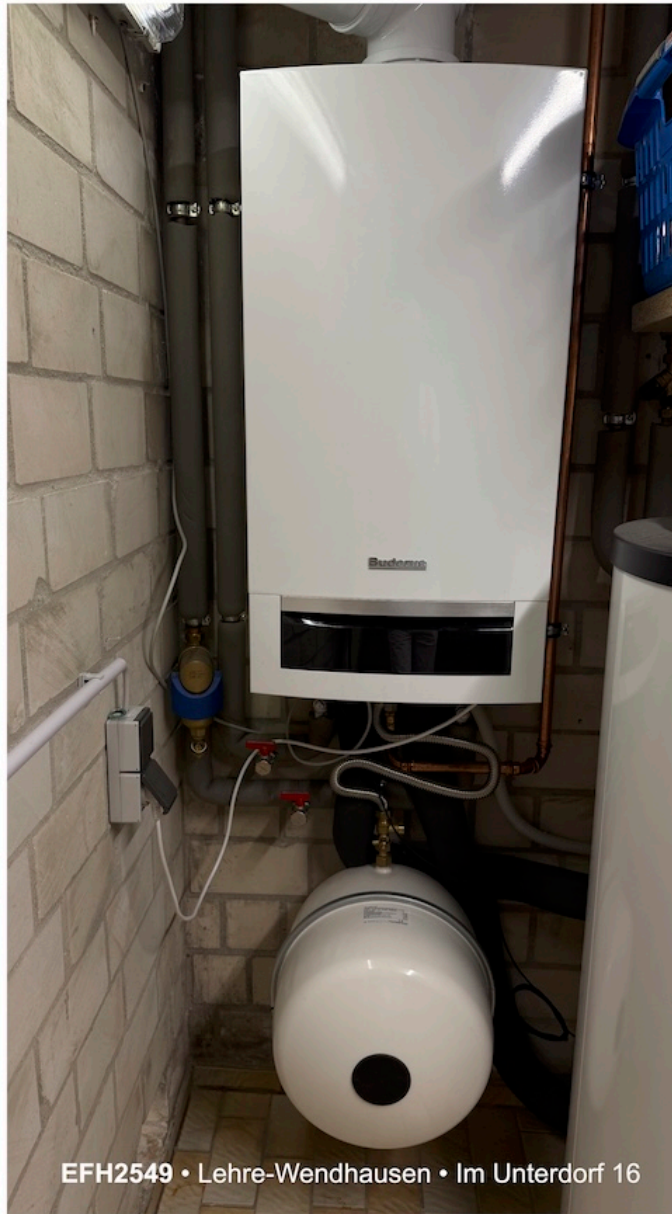
EFH2549 • Lehre-Wendhausen • Im Unterdorf 16