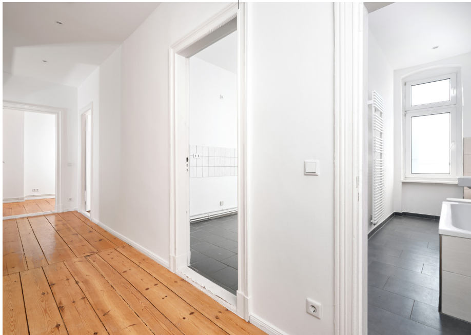
Unverbindliches Wohnungsbeispiel | Non-binding flat example