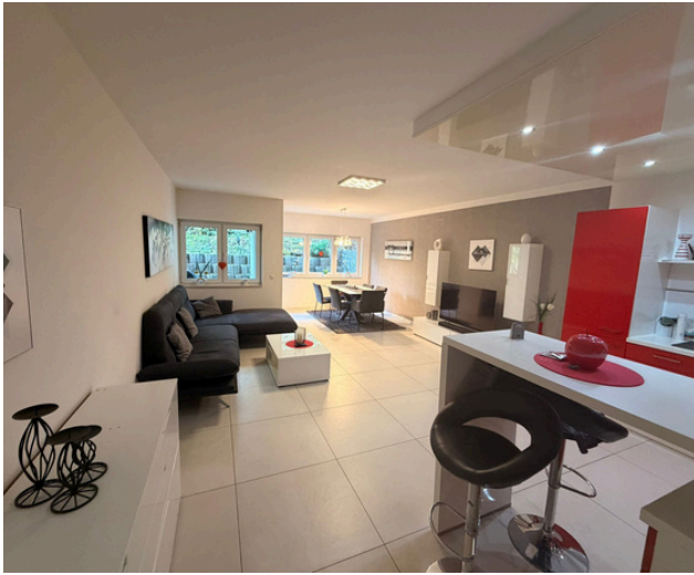
Offene Küche mit Wohnzimmer