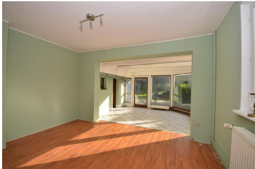
Esszimmer mit Wintergarten