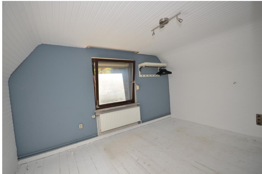
Zimmer im Obergeschoss