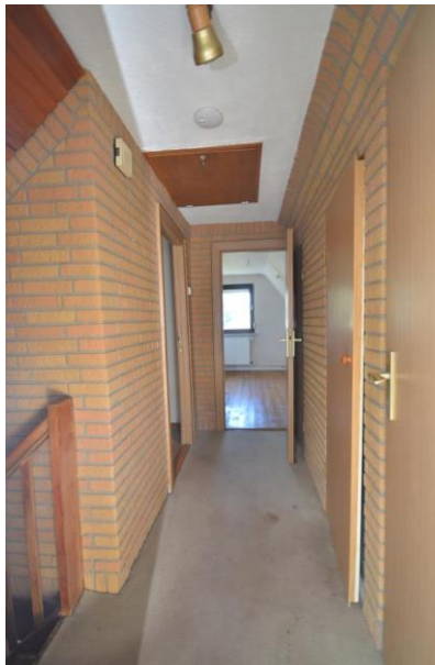
Flur im Obergeschoss