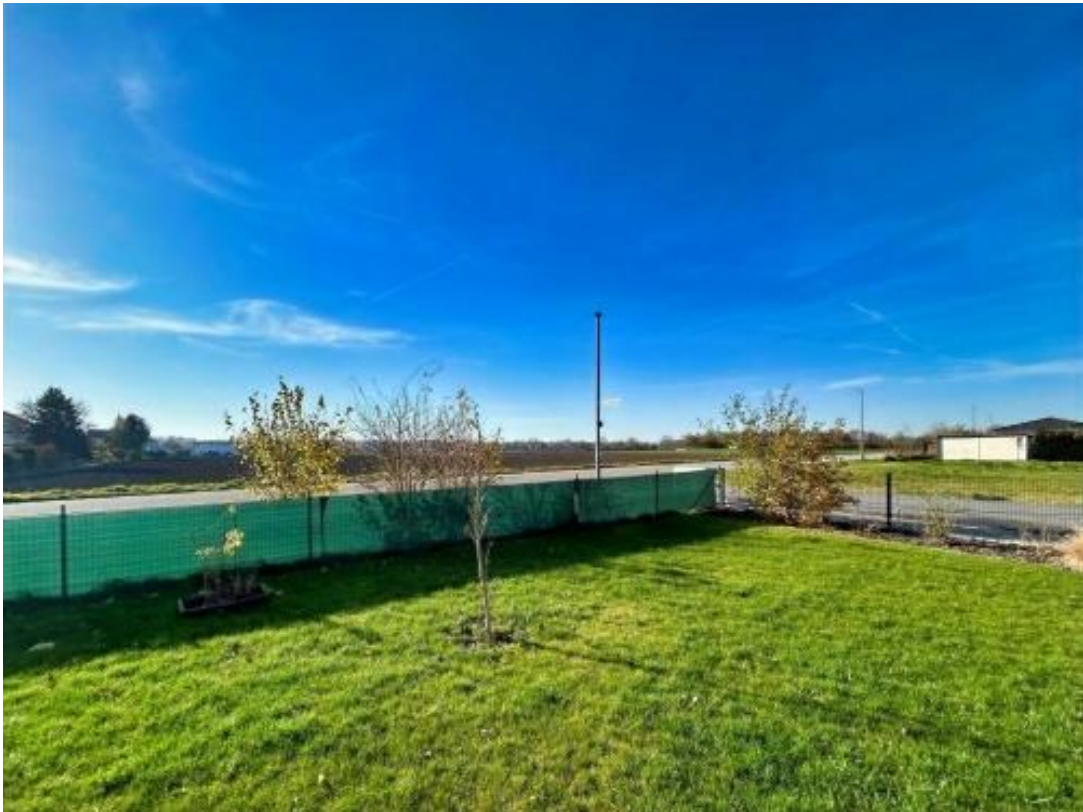
Garten mit Ausblick