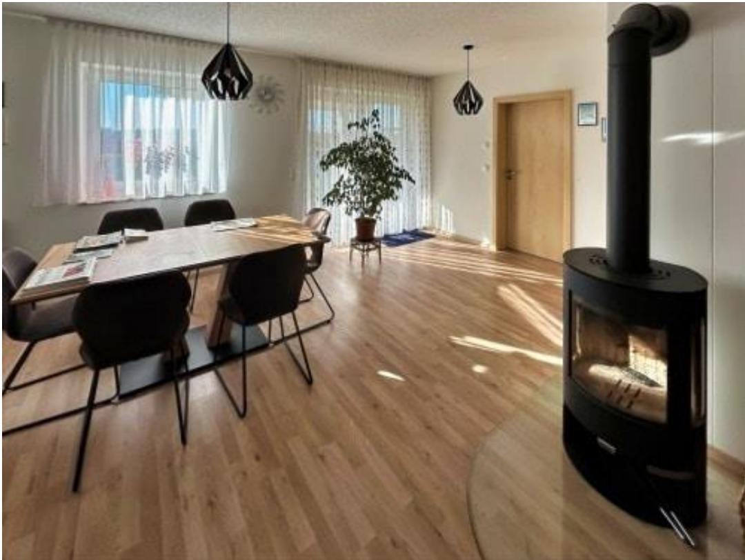
offener Wohn- und Essbereich