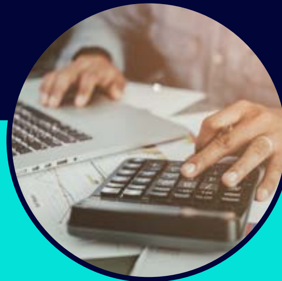
KP Finance GmbH

iw@weiheimmobilen.de www.weiheimmobilen.de