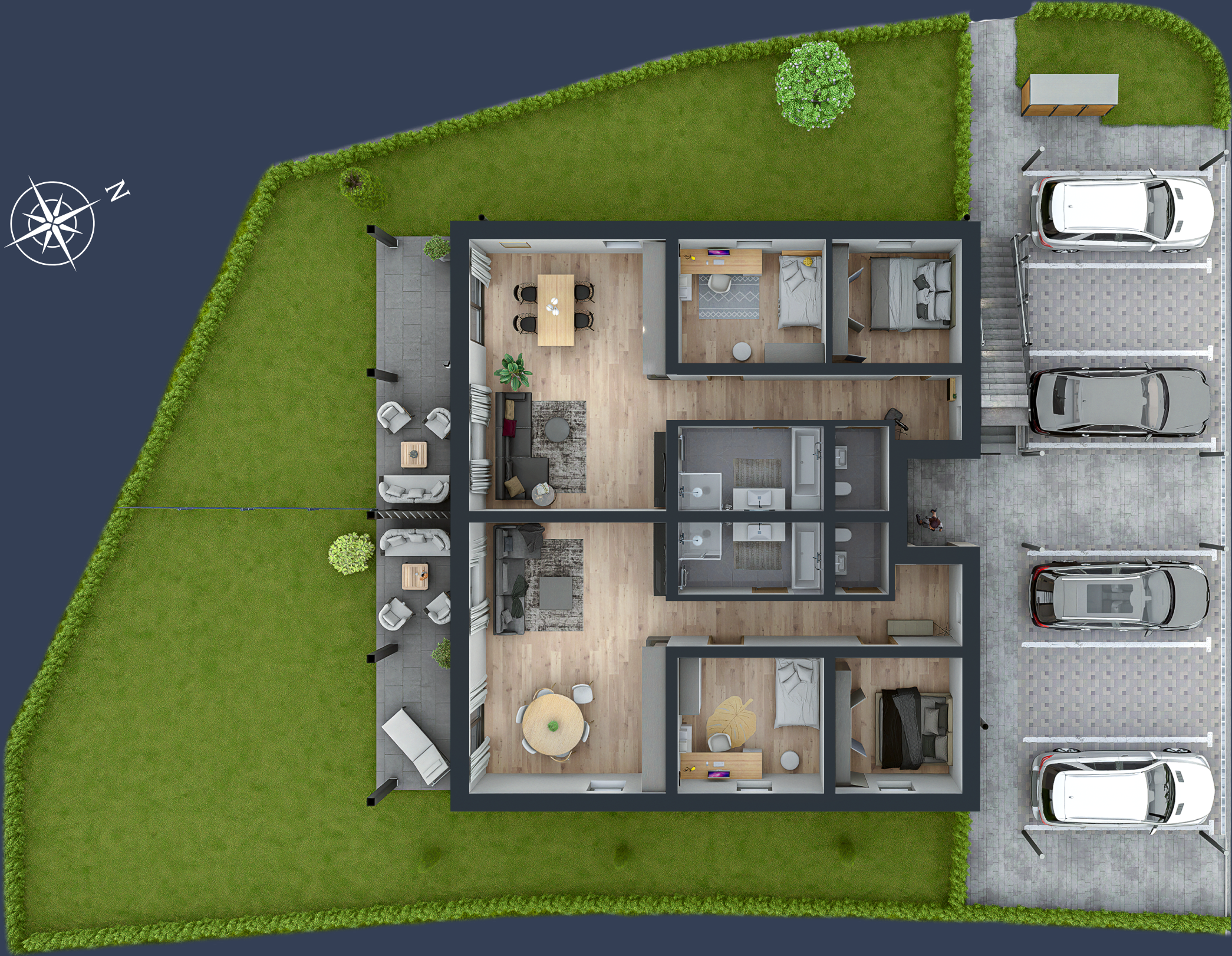
Am Hügel 7