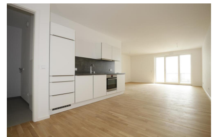
Küche & Abstellraum