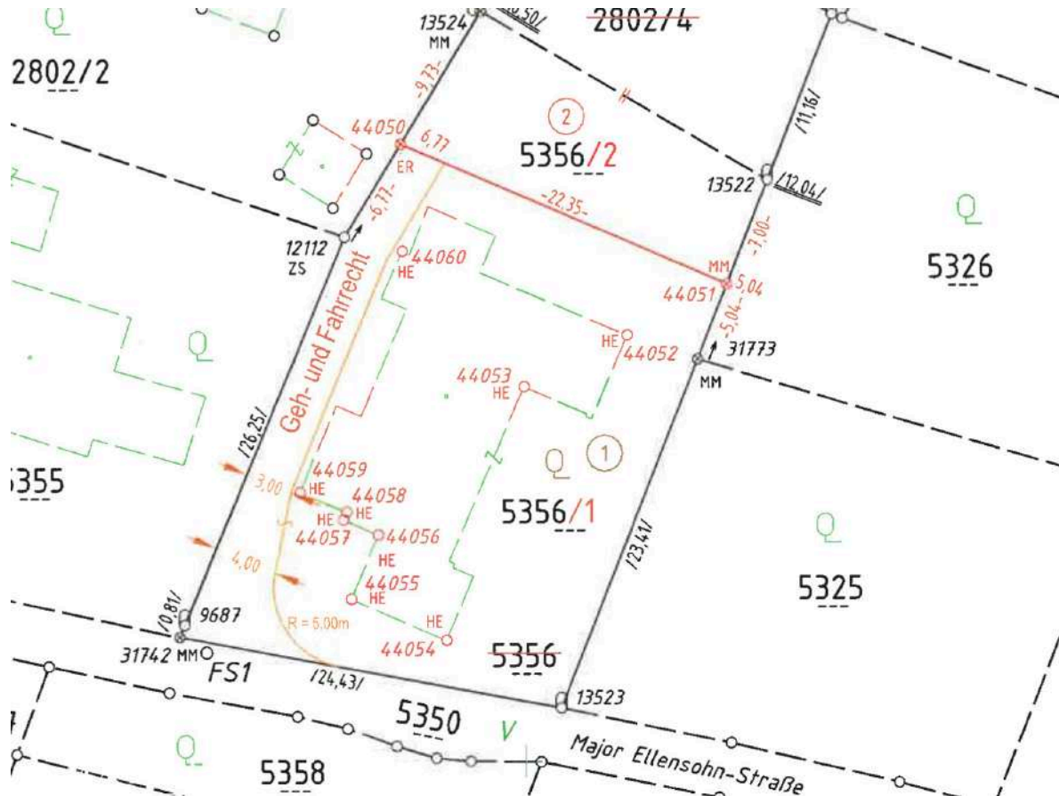
Grundstücksplan mit Geh- u Fahrrecht