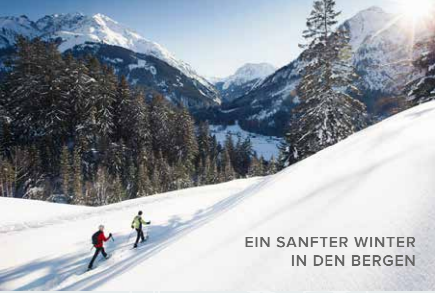
EIN SANFTER WINTER IN DEN BERGEN